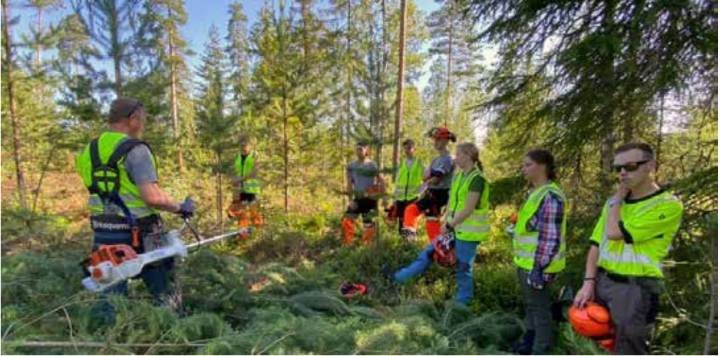
OSLO OG AKERSHUS: Opplæring ble gitt før disse ungdommene tok fatt på jobben i Nes kommune.