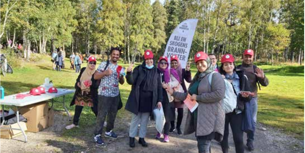
BLID GJENG: For å ivareta smittevernet var gruppene mindre og køene kortere enn tidligere år. Og stemningen var god.