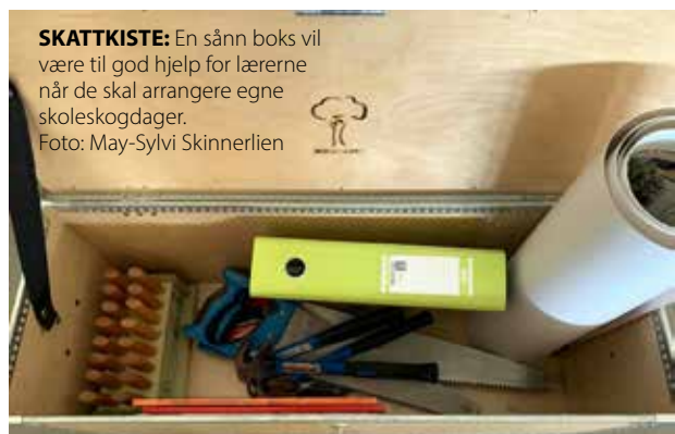
SKATTKISTE: En sånn boks vil være til god hjelp for lærerne når de skal arrangere egne skoleskogdager.

overrekke «Skoleskogdag-i-boks» til motiverte lærere ved et utvalg skoler utover høsten. I denne forbindelsen vil vi gi lærerne en innføring i hvordan de enkelte elementene i boksen kan brukes. Vi håper at Skoleskogdag-i-boks kan bidra til at barn lærer mer om skogen og gjør dem trygge der. Da blir de glade i skogen og forstår betydningen av en aktiv forvaltning. Så tar de også bedre vare på den! 🌱