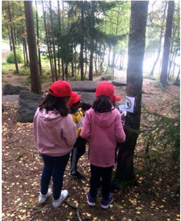
OPPGAVER: Ivrige jenter i Skogens Vokter-quiz!

Til høstens skoleskogdager har vi utviklet en natursti-quiz med tittelen Skogens