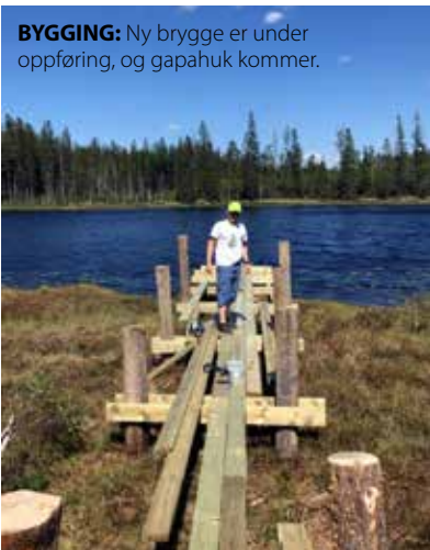
BYGGING: Ny brygge er under oppføring, og gapahuk kommer.