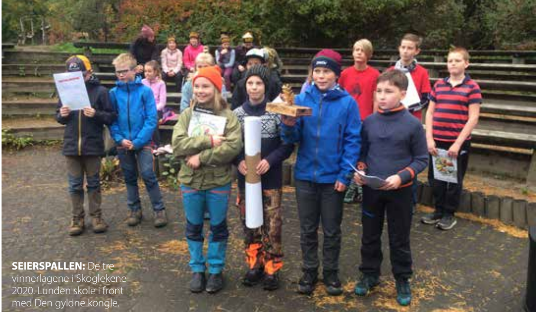
SEIERSPALLEN: De tre vinnerlagene i Skoglekene 2020. Lunden skole i front med Den gyldne kongle.