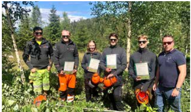
BUSKERUD OG TELEMAR: Fire JOB:U-deltakere etter endt ryddeoppdrag i Modum.

– Prosjektet hadde ikke vært mulig å gjennomføre uten finansiering fra Verdiskapingsfondet, næringen, offentlig forvaltning og ikke minst engasjementet hos de enkelte kommunene. Her har alle gjort en god jobb, sier Rønningen. I Oslo og Akershus har prosjektet vært gjennomført i Nes kommune. Seks ungdommer ryddet 400 mål ungskog etter først å ha gjennomført et todagerskurs i ungskogpleie. Prosjektet var et