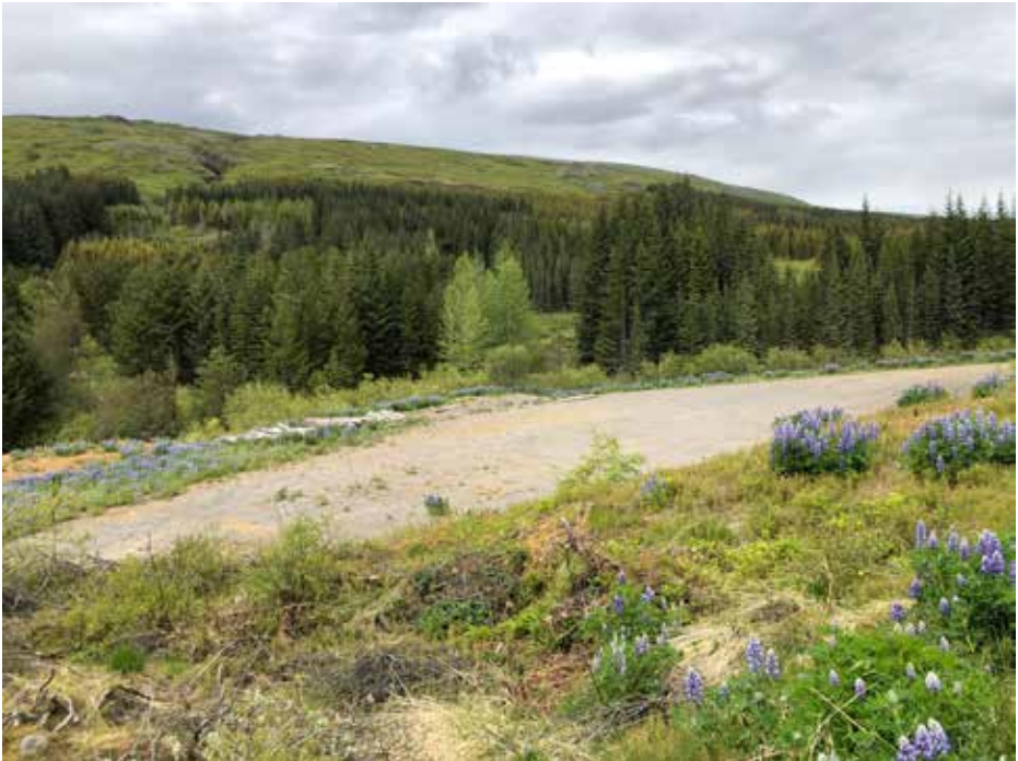
Et typisk Islandsk landskap som er resultatet av langsiktig skogreisning.

Vi fikk med oss to lange innholdsrike fagdager med mye bilkjøring og et godt faglig program.