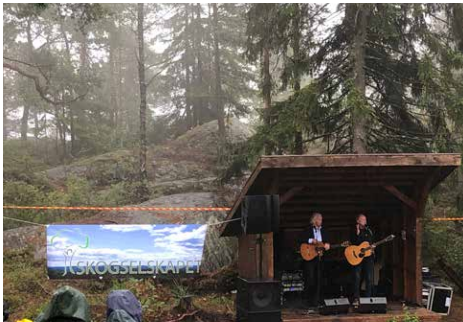
Halvdan Sivertsen og Jan Eggum avholdt friluftskonsert på Linnekleppen.

Skogselskapet hadde ansvaret for transport og matserveringen under Rakkestad kommunes konsert med Halvdan Sivertsen og Jan Eggum den 17. august 2019. Konserten ble en suksess tross for utfordrende vær. Det regnet og blåste under hele konserten uten at det la noen demper på stemningen som var god. Ca. 500 personer gikk den 3,5 km lange spaserturen opp til tårnet for å nyte helgrillet elg med tilbehør og konserten. Takket være det gode samarbeidet vi hadde med Skogselskapene i Buskerud, Oslo/Akershus gikk gjennomføringen av konserten uten problemer.