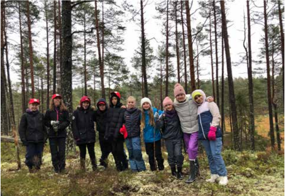
Skoleskogdag på Prestebakke.