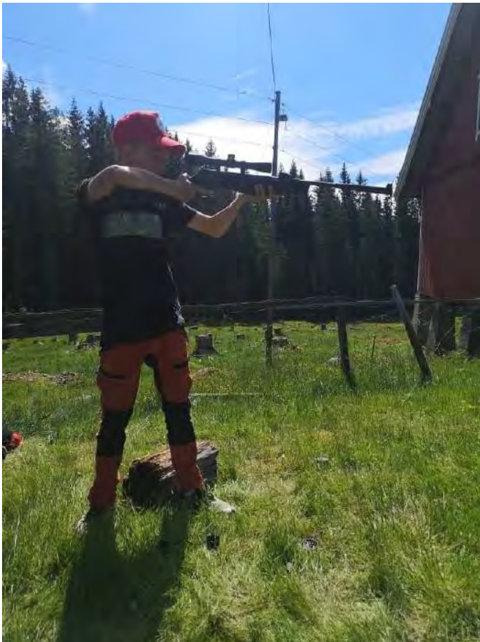
Luftgeværskyting er en populær aktivitet på skoleskogdager.

Skogselskapet i Hedmark har bidratt på ulike arrangement hvor temaet har vært å øke bevisstheten om skogens betydning for Hedmark.