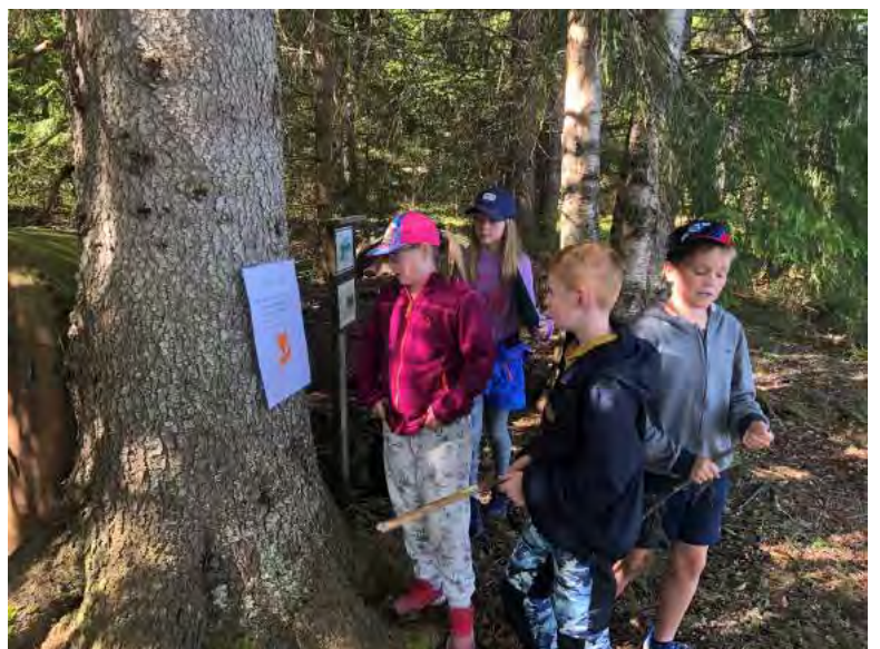
Natursti på skoleskogdag på Eidskogen