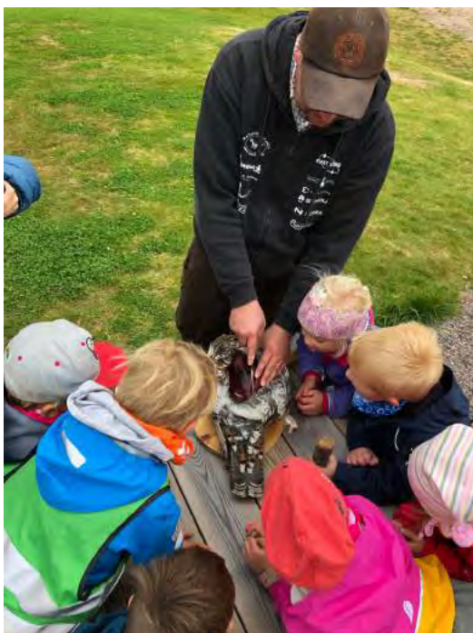
Bærekraftig hosting av naturressursene synes Skogselskapet er en viktig oppgave å formidle

Send innmeldingen til Skogselskapet i Hedmark til e-post gjems@skogselskapet.no eller brev til Skogselskapet i Hedmark, Solørveien 151, 2207 Elverum. Man kan også sende innmelding via hjemmesidene våre. Husk å oppgi hvem som har vervet det nye medlemmet.