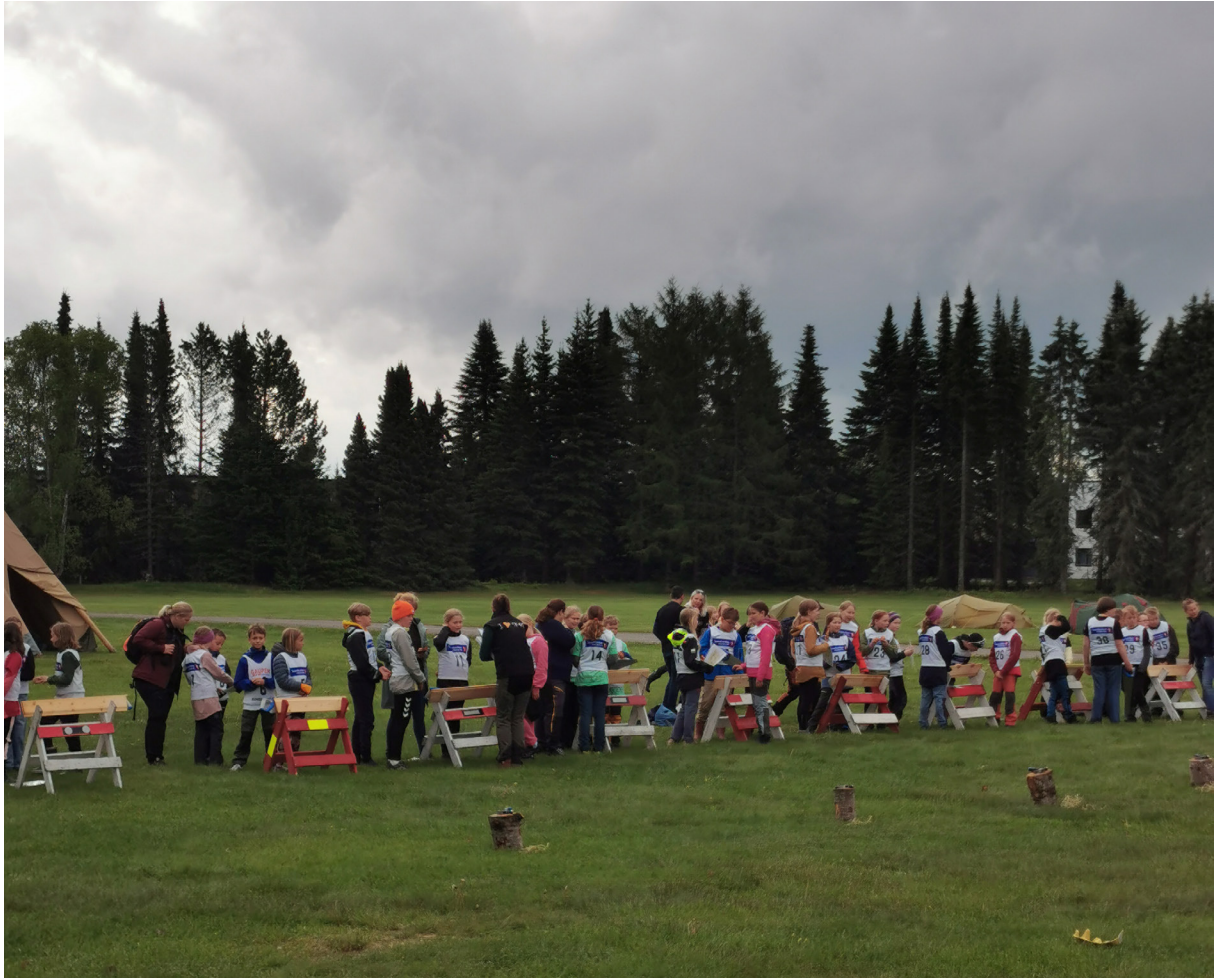
8. juni: Finale Skoglekene