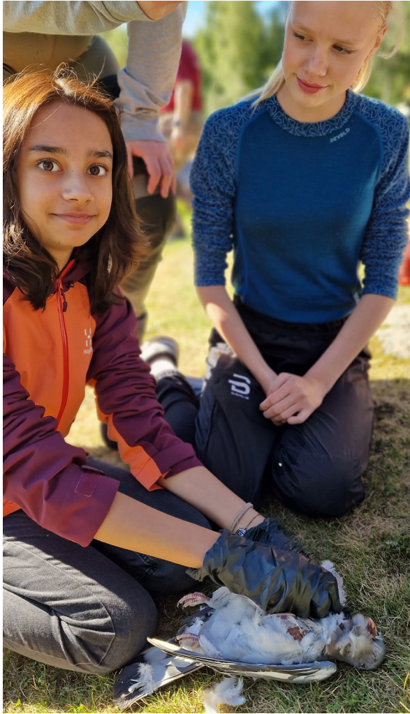
22. august: Duejakt Åsnes 9A og 9B