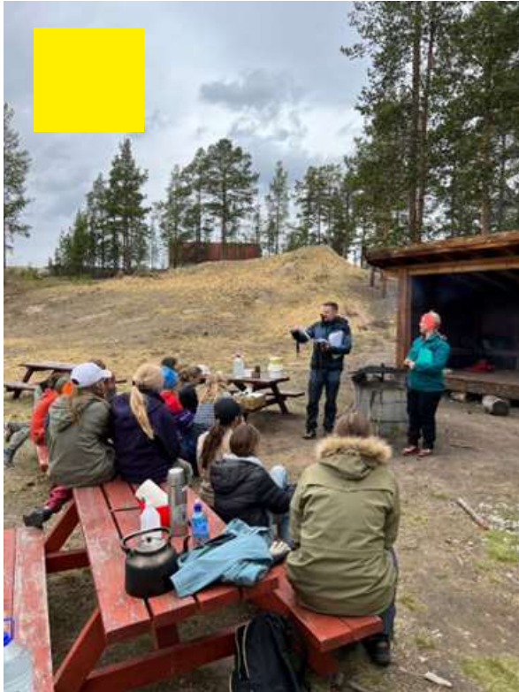
24. mai: Skoleskogdag Folldal