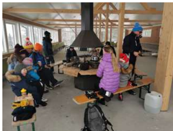
23. februar: Åpning av Skogshuset Natrudstilen i Ringsaker kommune