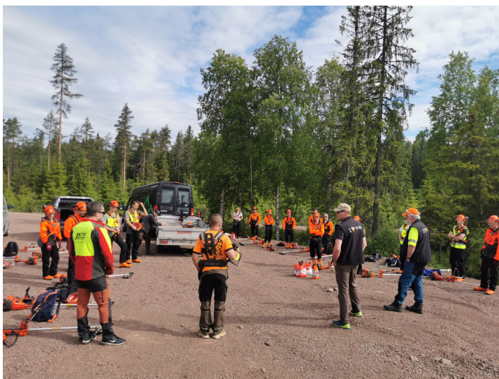
20.–24. juni: Kurs JOB:U Sønsterud

JOB:U ble i 2022 gjennomført i Eidskog, Kongsvinger, Grue, Våler, Åsnes, Trysil, Åmot, Stor-Elvdal, Løten, Stange og Romedal, Nord-Odal, Ringsaker, Brandbu og Gran.