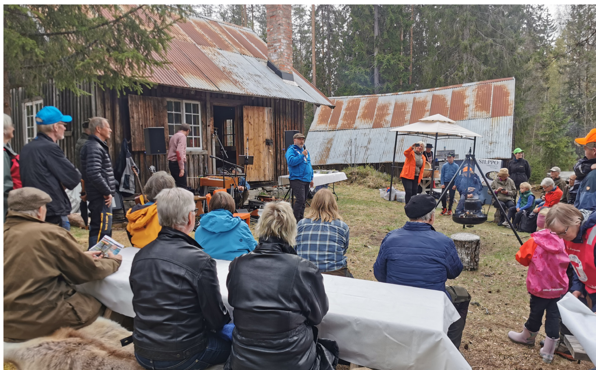
Fra fjorårets årsmøte.

Gratis inngang for alle skoginteresserte!