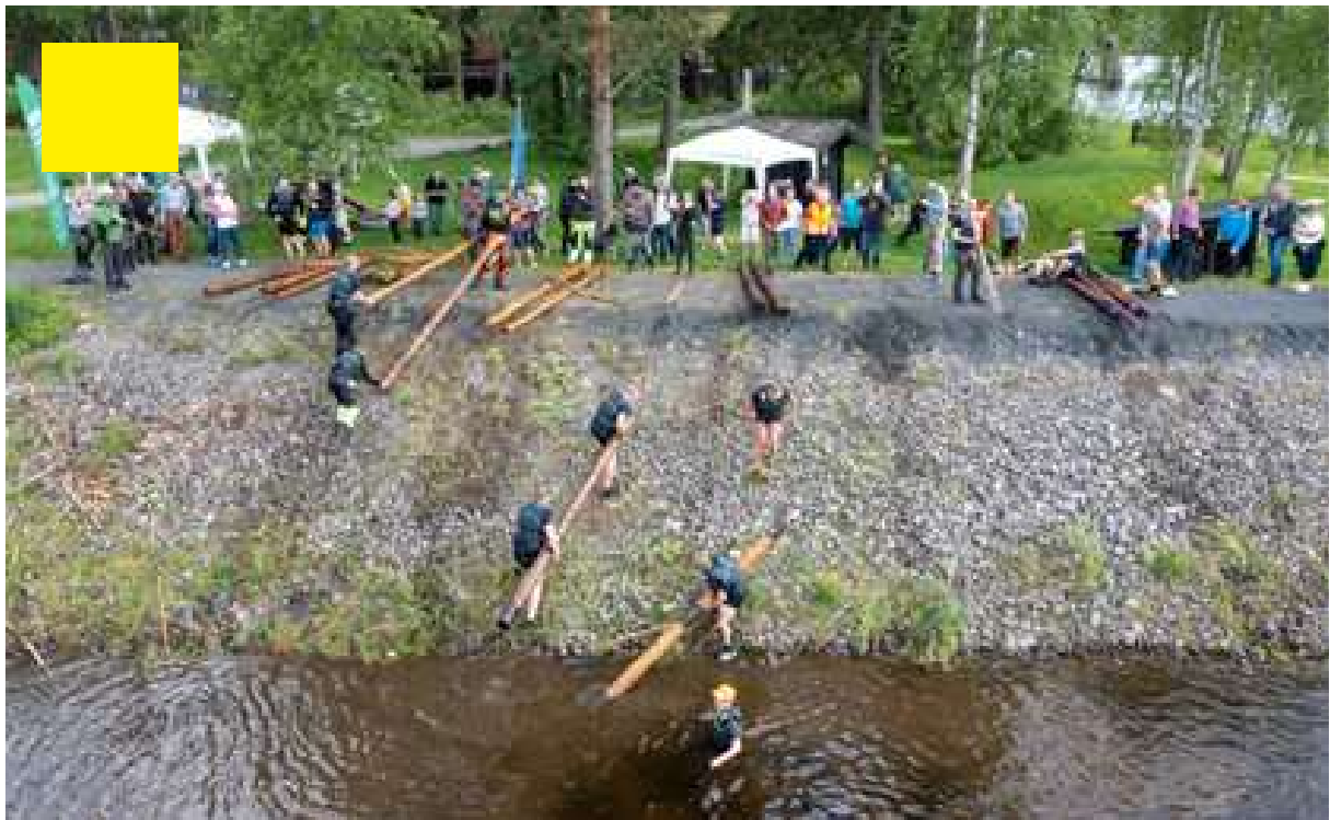
10.–11. juni: VM i tømmerfløting i Elverum kommune