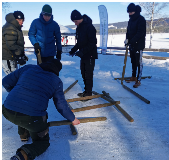
8. mars: Skogsti, skogkunnskap og isfiske Gjesåssjøen 10. trinn Åsnes