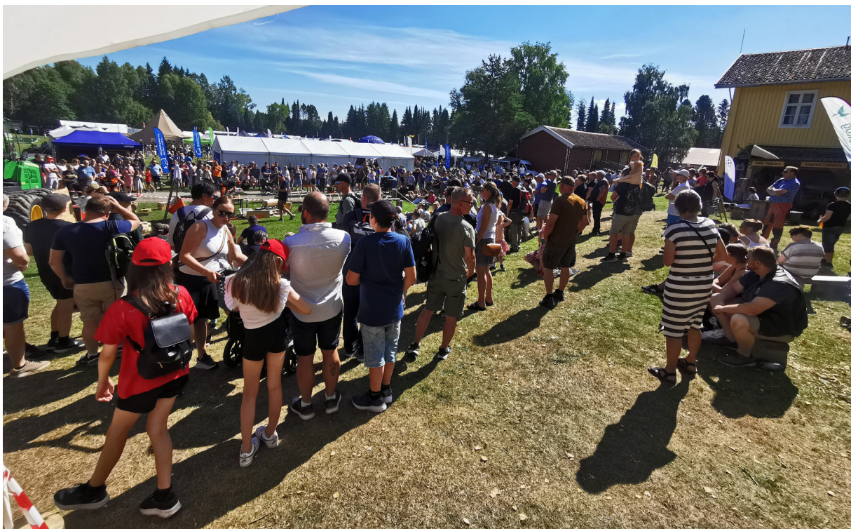
10.–14. august: De nordiske jakt- og fiskedager

JOB:U ble i 2022 gjennomført i Eidskog, Kongsvinger, Grue, Våler, Åsnes, Trysil, Åmot, Stor-Elvdal, Løten, Stange og Romedal, Nord-Odal, Ringsaker, Brandbu og Gran.