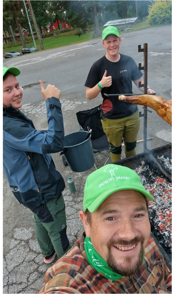
3. september: Skogdag Sønsterud skole med helgrillet villsvin