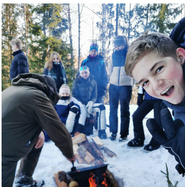
8. februar: Harejakt Våler, 9. trinn