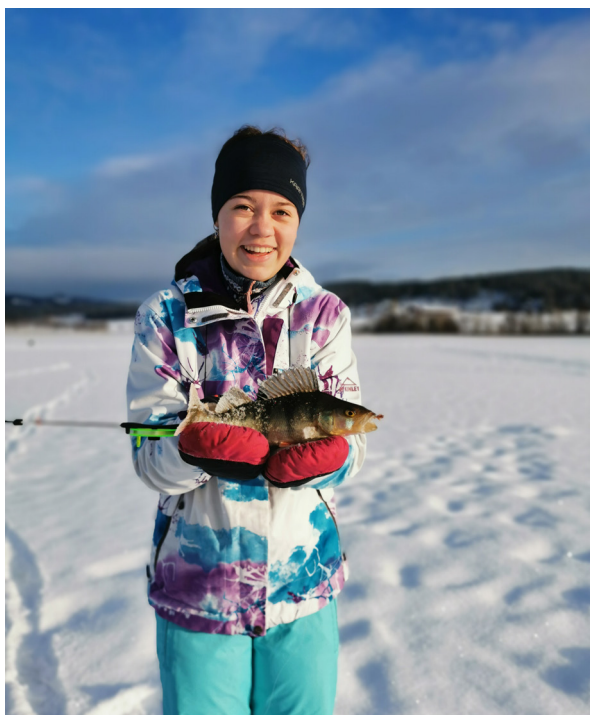
2.-3. februar: Isfiske Gjesåssjøen Åsnes 9B og 9C