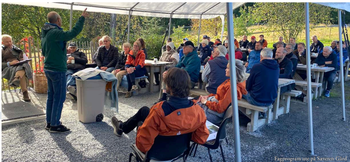
Fagprogram ute på Sæteren Gard