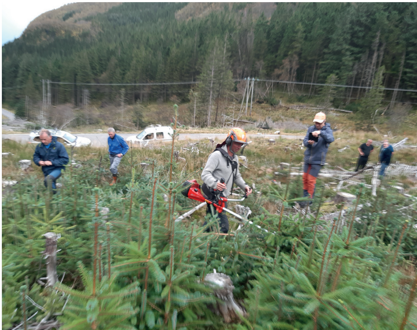
Skogdag med fokus på ungsogpleie av sitkagran i Takledalen

Det har ikkje vore slike kontrollar i 2021.