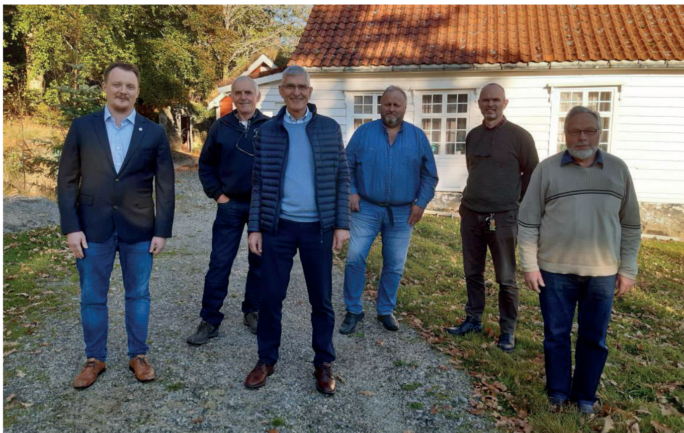
Styret i Sogn og Fjordane Skogselskap.