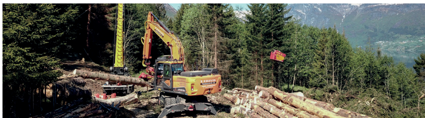
Taubanedrift i Stryn