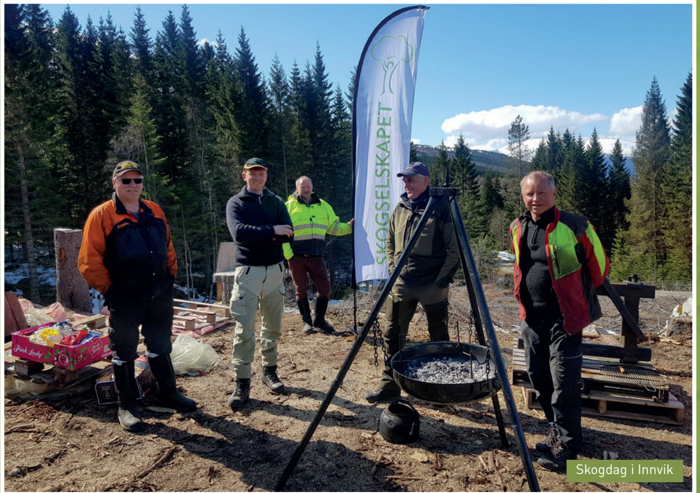
Skogdag i Innvik