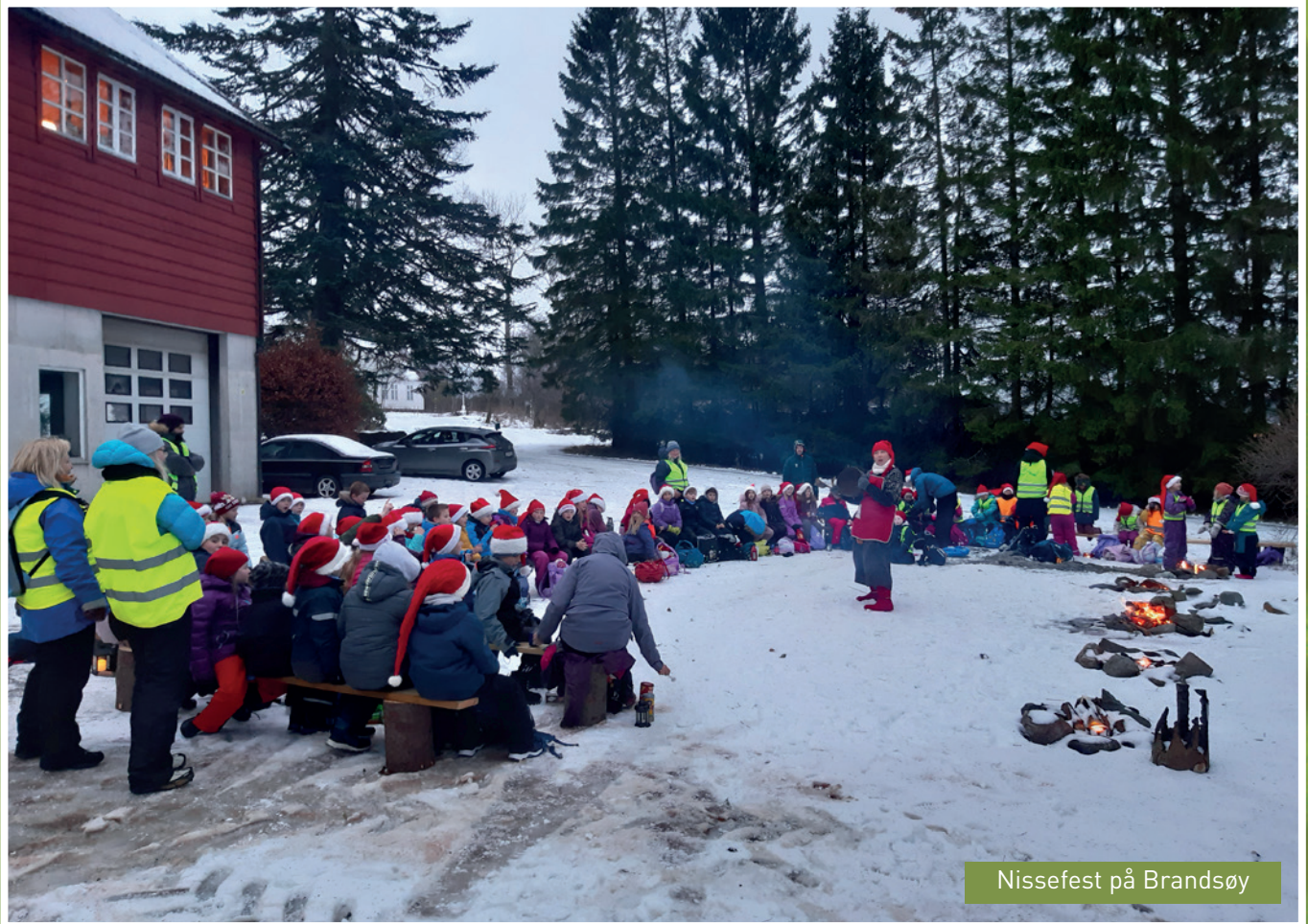
Nissefest på Brandsøy