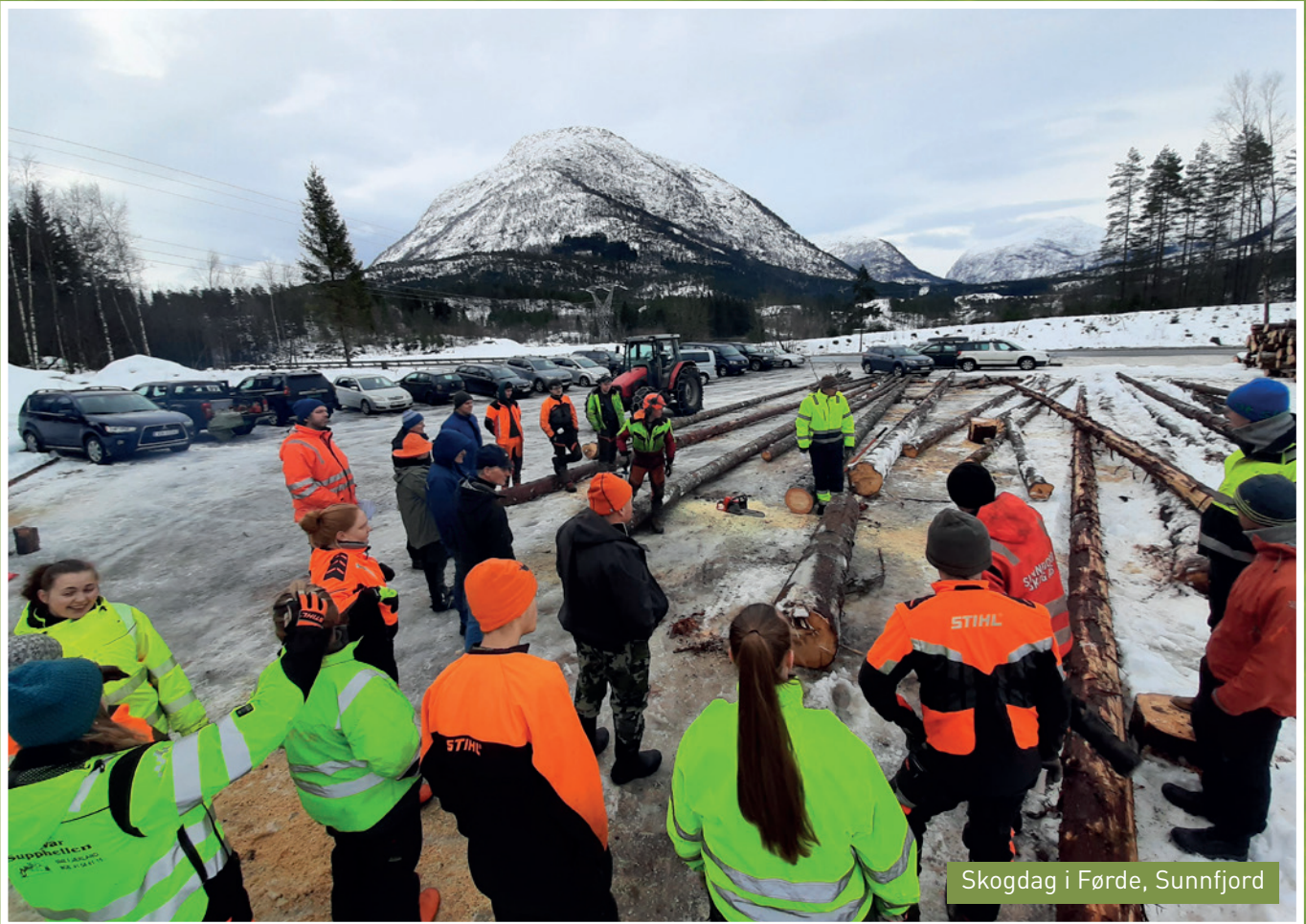
Skogdag i Førde, Sunnfjord