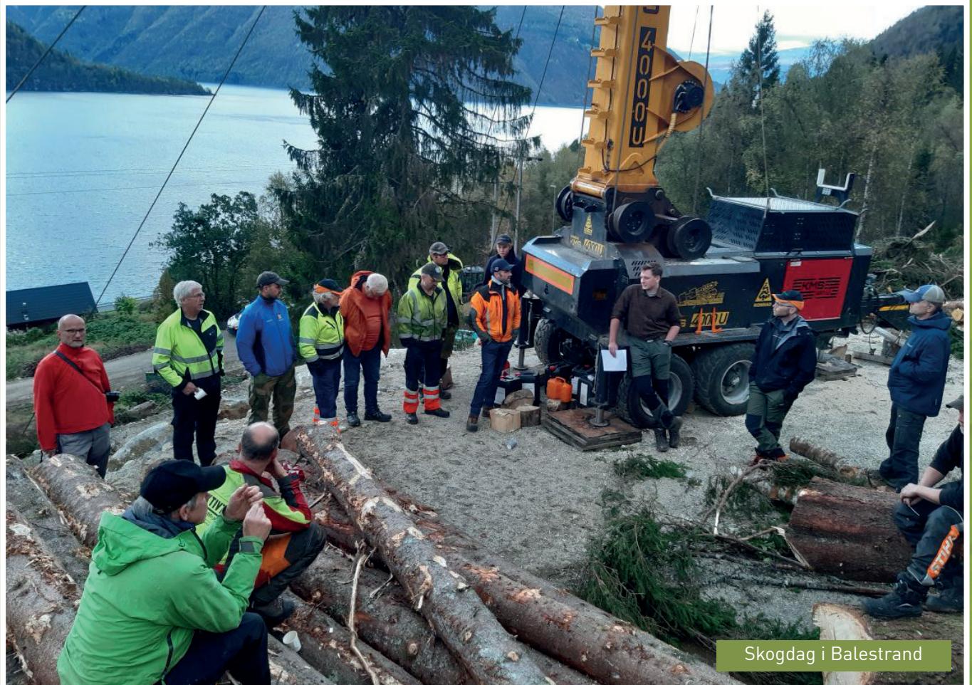
Skogdag i Balestrand