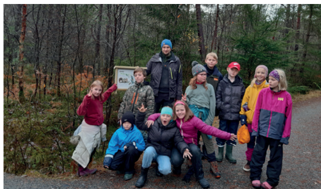
Skuleskogdag på planteskulen i Brandsøy.