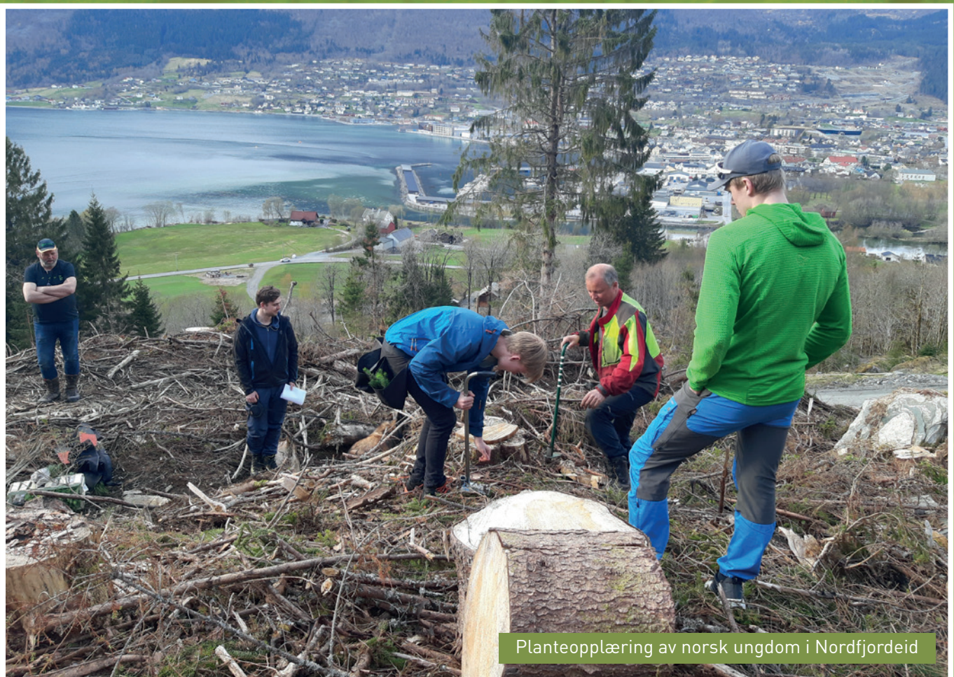
Planteopplæring av norsk ungdom i Nordfjardeid