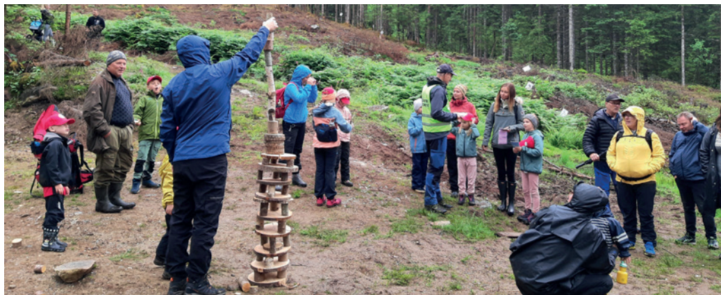
Stubbekonsert og familiedag på Moskog

Innestående skogfond pr. 31.12.2021: kr 8 890 123.