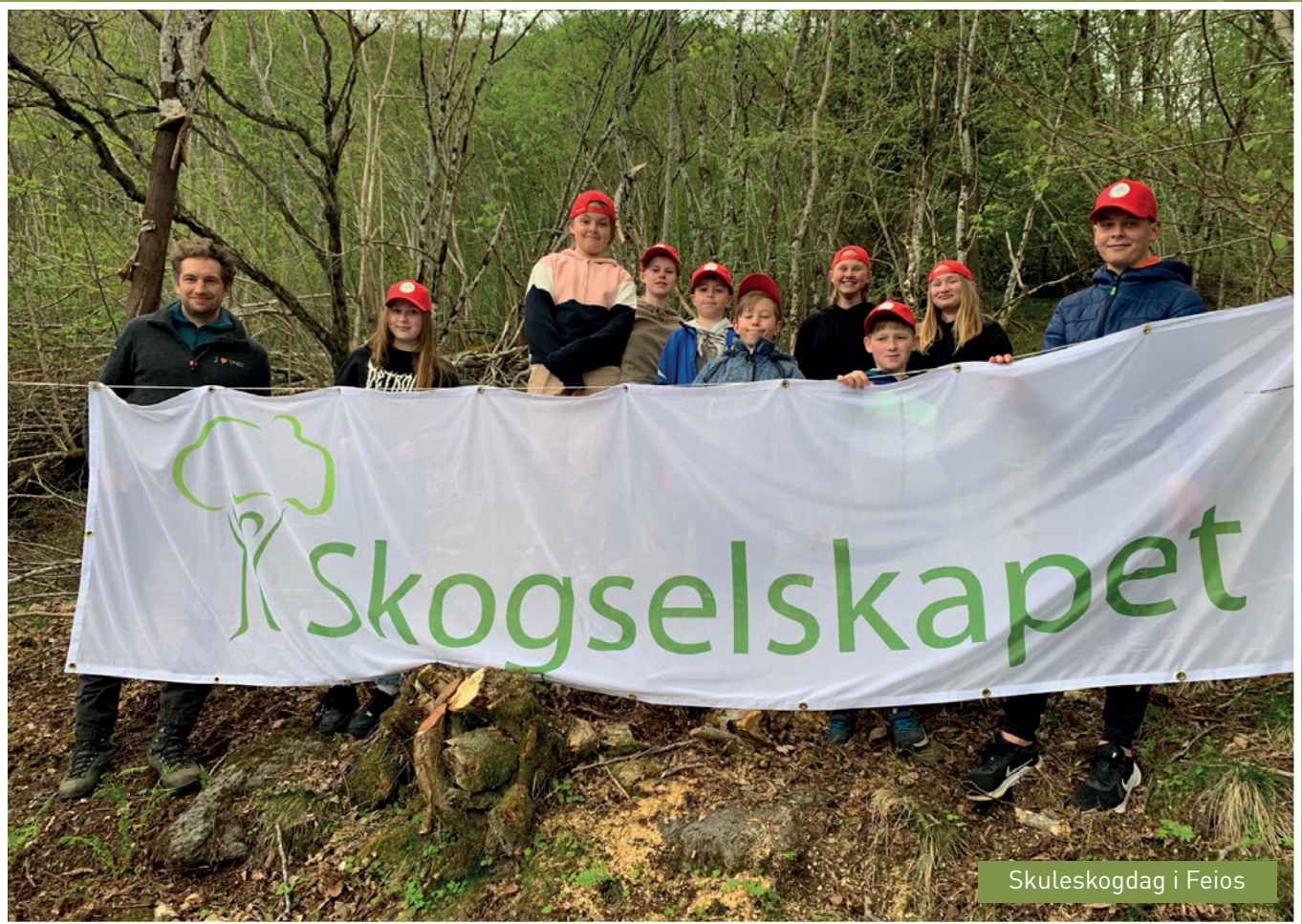
Skuleskogdag i Feios