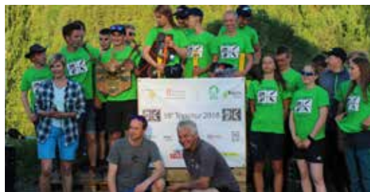
BUSKERUD: Kongsberg vgs avd Saggrenda gikk igjen seirende ut av konkurransen 59*Topptur.

Vi ønsker naturligvis å rette en kjempstor takk til våre sponsorer og samarbeidspartnere: Buskerud fylkeskommune, Fylkesmannen i Buskerud, Rost-