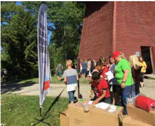
TEST: Teorikunnskaper ble testet ut via quiz og skogbrannvokterprøve og 1400 nye brannvoktere kunne iføre seg den røde capsen disse dagene.

Skog og Vann 2018 samlet nærmere 3000 grunn- skoleelever fra 13 barnehager, 74 skoler, med 3-400 lærere og ledsagere, i første rekke fra fylkene Hed- mark, Oppland og Akershus. En håndfull voksne elevgrupper fra læringscentre for innvandrere og asylsøkere var også innom arrangementet.