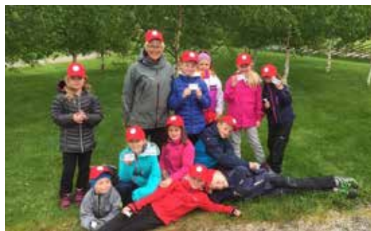
TRØNDELAG: Skogselskapet deltar i kampanjen Skogens brannvoktere også i Trøndelag.

En av vårens store oppgaver ute i felten er for Stiftelsen Det norske Skogfrøverk. I disse dager etableres forsøksfelt på fire ulike steder i Trøndelag; Sandholtan på Melhus, Skjørholmen i Verdal, Ravaldmoen