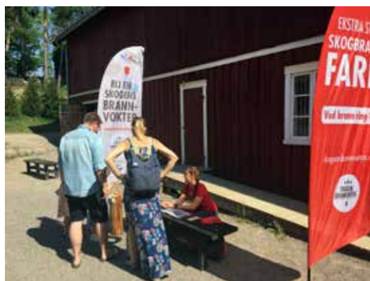
VERVING: Skogselskapet fikk også sprede informasjon om skogbrannfaren og vervet nye skogbrannvoktere på folkemuseet.

ENERGI: Den som hogger sin egen ved blir varm to ganger. Minst. Dette ble demonstrert på en dag da den direkte solenergien egentlig hadde vært tilstrekkelig.