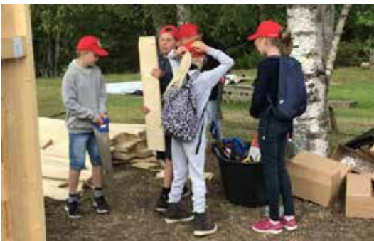
OPPLAND: Plankehyttebygging var en del av opplegget på Skog og Vann

På Skogmuseet på Elverum kommer det ca 3000 elever fra hele Østlandet hvert år for å lære om skog, klima og historie. Skogselskapet hadde plankehyttesnekring og skogbrannkampanje. Alle elevene som var der ble Skogbrannvoktere. Skog og Vann er en fin mulighet til å treffe elever og ikke minst lære og snakke med dem om temaet. Skogselskapet i Oppland avtalte tre nye skoleskogdager på høsten med lærere vi traff her. To i Gjøvik og en fra Vang i Valdres. Disse skolene i Oppland deltok: Raufoss skole, Nord-Aurdal skole, Fåvang skole, Blomhaug skole, Grande Skole, Vindingstad skole, Gjøvik skole, Vingrom skole, Jørstadmoen skole, Reinsvold skole, Solvang og Aurvold skole Øyer. Mer om Skog og Vann og Skogens brannvoktere på side 5 og 6