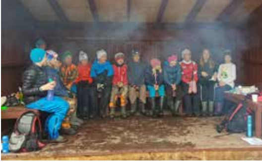
HEDMARK: Skogselskapet fikk være med Folldal barneskole på skogdag.

bål stod på programmet. Skogselskapet bidro også med litt kunnskap om skogen og treslag. Fristen for å sende inn oppgaver knyttet til skoglekene var på fredagen, så litt kunnskap om treslag var ønskelig fra elevene. Til tross for lite innslag av varmekjære treslag i Folldal var kunnskapen til elevene overraskende god og det tok ikke lang tid før de kunne gjengi treslag de aldri hadde hørt om. Da gjenstår det å se om de klarer å kvalifisere seg til finalen i skoglekene 2018.