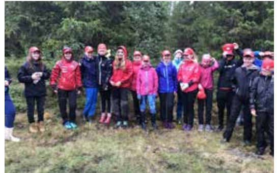
OPPLAND: Åttende trinn ved Ringebu ungdomsskole har vært med Skogeselskapet på skogdag og blitt skogbrannvoktere.