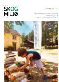
Forsidefoto: Vedstabling under Rå Kraft på Norsk Folkemuseum.