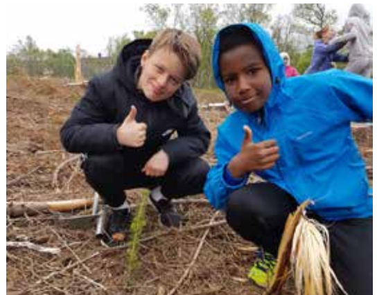
HELGELAND: Tommel opp for skogplanting.

Skogselskapets representant hadde sin første skogdag ute på en hogstflate og fikk reflektert en del over det barna sa om at det var synd at trærne ble hugget ned. – Det måtte jeg jo nesten si meg enig med dem i, de er jo flotte å se på! Men da fikk jeg fortelle om alle de fantastiske produktene vi kunne lage av nettopp disse tømmerstokkene, at de kunne bli til hus og papir, klær og til og med vaniljesmaken i marshmallows, sier han. Og dette var spesielt spennende for barna, kanskje fordi de fikk med seg nettopp marshmallows til å spise. Og det virket som om de fikk forståelse for at dette var en fin produksjon, i alle fall når det blir plantet etterpå og det kommer opp nye granplanter som i løpet av sitt liv også skal få lov til å bli disse utrolige produktene.