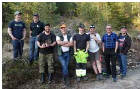
AGDER: Nye skogeiere har fått tilbud om kurs. Her fra kurs i Grimstad.

Nylig var det kurs på Byremo i Audnedal kommune. Denne kurskvelden var inne og med fokus på mange enkle, men viktige temaer som nyere skogeiere vil komme bort i. I midten av juni ble det inviteret til en skogvandring med fokus på veivedlikehold, hogstmoden skog, skogskader etter vinteren, planting, ungsogspleie osv.