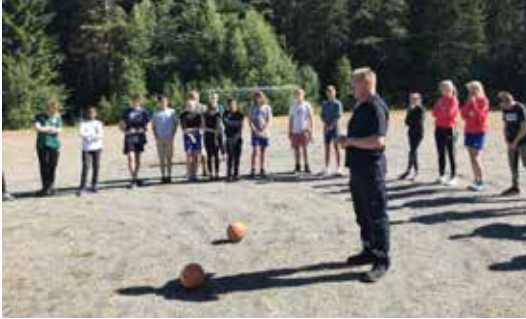
OPPLAND: Brannsjefen orienterte om skogbrannfaren på skogdagen for 9. trinn i Søndre Land.

raskt som mulig når en brann er oppdaget. Skogstudentene fra Valle Videregående skole var også med for å informere om utdanningsvalgene elevene har innen naturbruk.