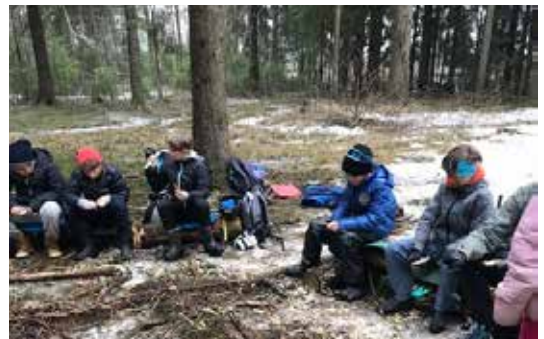
OSLO OG AKERSHUS: Spikking var en av aktivitetene på skogdag med Jessheim skole- og ressurscenter.

Skogselskapet i Oslo og Akershus er også i dette skoleåret godt i gang med skoleskogdager for 6. klassetrinn i Akershus. Da halve mai var gått, hadde vi hatt med over 1000 skolebarn ute i skogen. Før sommerferien kommer rundt 2000 barn til å ha vært med Skogselskapet på tur ut i skogen. Skogselskapet i Oslo og Akershus har lang tradisjon for å drive med skoleskogdager for sjetteklassinger.