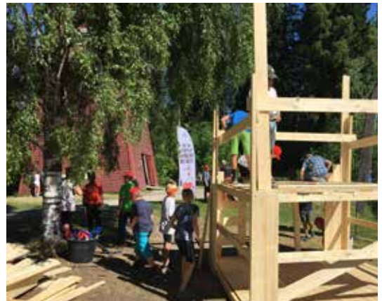
TREBYGG: Snekring fenger, og nok en gang ble et nytt trebygg oppført.