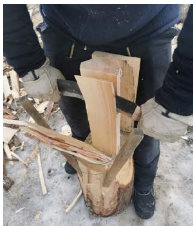
RETTKLØYVD: Virket fra Skogselskapets eiendom egnet seg godt.