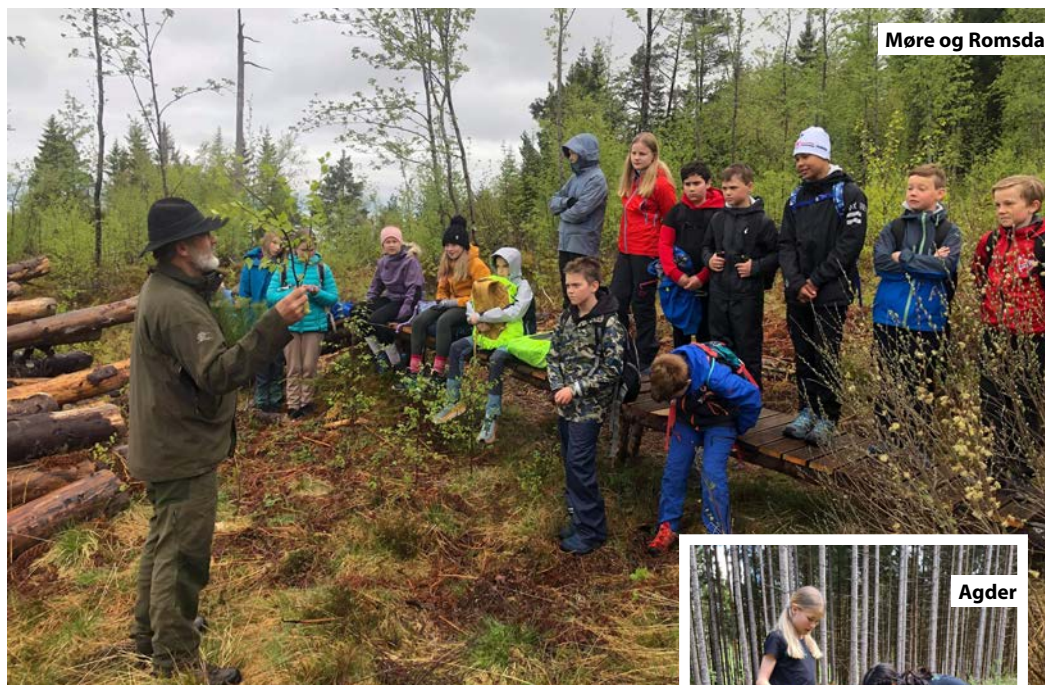
Møre og Romsdal