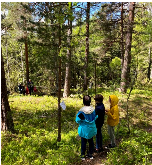
UTEDAG: Skoleskogdagene er en av Skogselskapets «merkevarer» som hundrevis av skolebarn blir introdusert for i disse dager.

Så er det også skoleskogdager hvor det skjer noe litt ekstra. I vår har mange skoler vært med på skogplanting (se egen sak om dette). Skogselskapet i Buskerud og