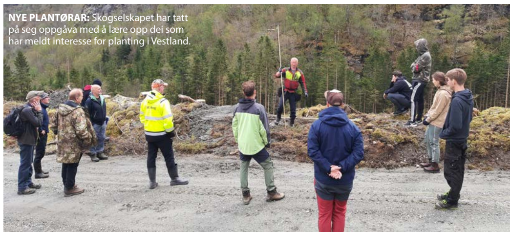
NYE PLANTØRAR: Skogselskapet har tatt på seg oppgåva med å lære opp dei som har meldt interesse for planting i Vestland.