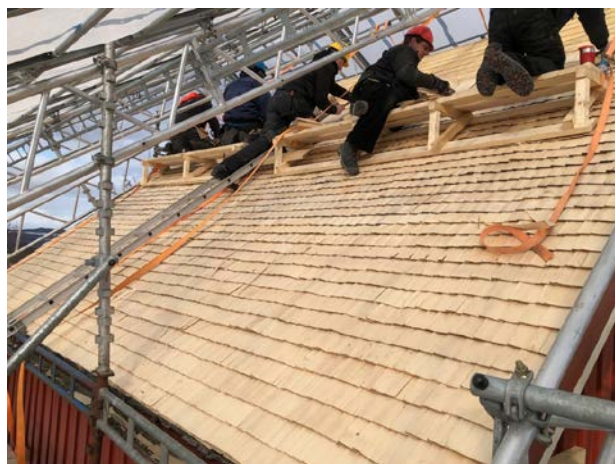
VAKKERT: Spontekket tak er flott å se på, men gjør seg ikke selv. Mange hender må til.