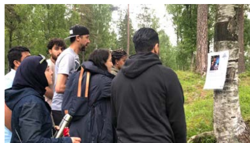
QUIZ: Spørsmål om skog og skogbrann.

Det var god stemning og stort engasjement blant deltakere og de forskjellige aktørene da vi endelig igjen kunne åpne for et stort antall deltakere på årets Flerkulturell Friluftsfest etter to år med smittevernsbegrensninger. Skogselskapet inviterte til to forskjellige quizzer om skog og natur, og gledet oss over gode samtaler og spørsmål som dukket opp underveis i løpet av dagen. 🍃