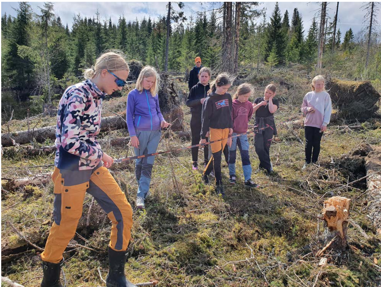
KONTROLL: Med snor og mange øyne til å telle ble plantetettheten kontrollert.