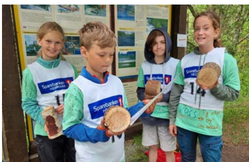
BRENNVERDI: I bioenergioppgaven skulle deltagerne kjenne på vekten av forskjellige treslag og sette de rekkefølge etter vekt.

Kvalifisering til finalen har skjedd gjennom tre runder der 105 klasser deltok i første runde og 79 klasser i andre runde. I tredje runde var det til slutt 11 skoler som kvalifiserte seg til finalen. I løpet av de innledende rundene har det vært gjennomført 16 skoleskogedager i samarbeid med Skogselskapet.