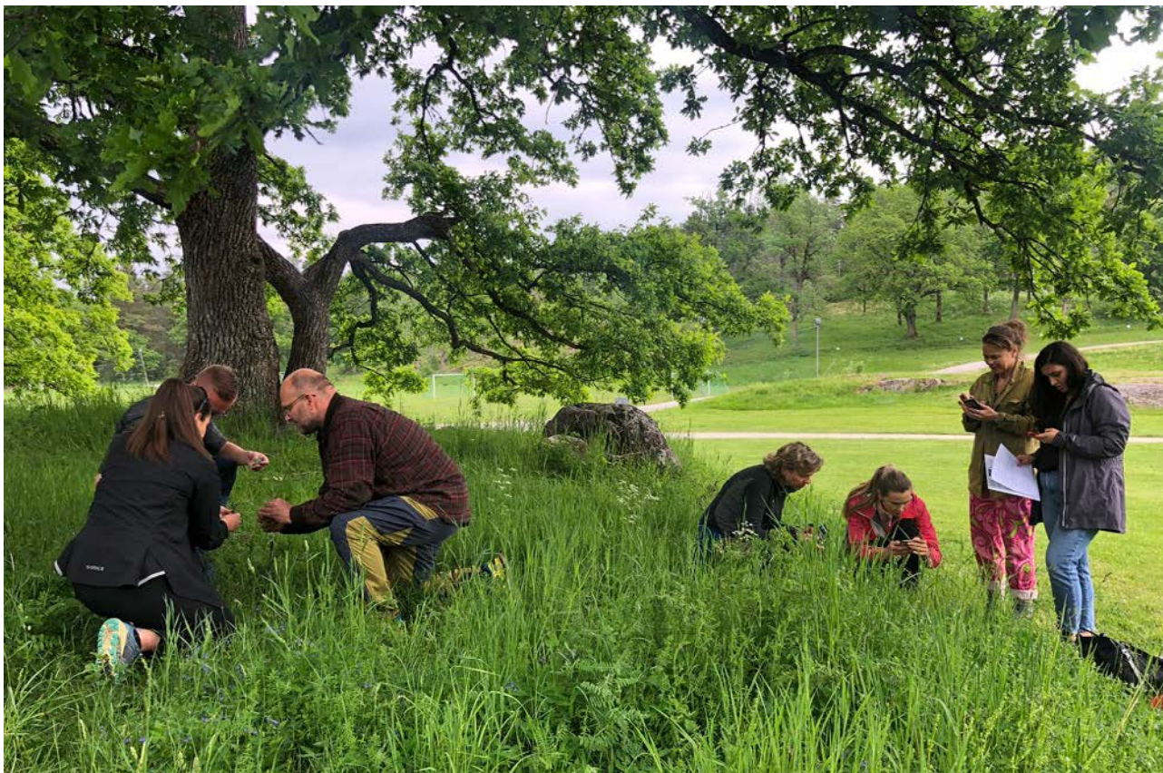
NATURSTUDIER: Lærerne i dypt fokus. Registrering av arter og hvor vanlige de er.