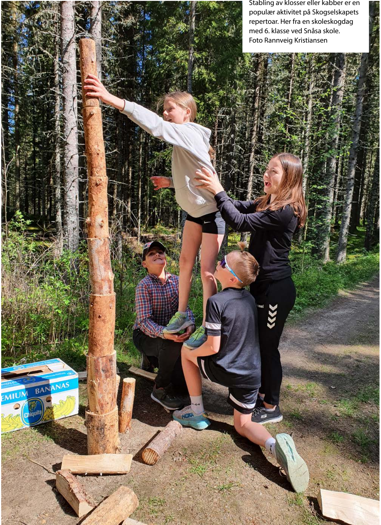
Stabling av klosser eller kabber er en populær aktivitet på Skogselskapets repertoar. Her fra en skoleskogdag med 6. klasse ved Snåsa skole.