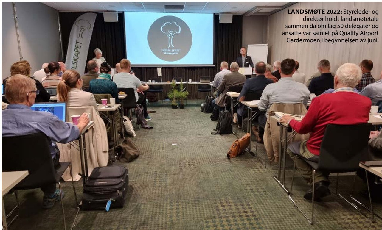
LANDSMØTE 2022: Styreleder og direktør holdt landsmøtetale sammen da om lag 50 delegater og ansatte var samlet på Quality Airport Gardermoen i begynnelsen av juni.

medlemshåndtering bort til ett fylkesskogselskap eller til DnS og dermed frigjøre tid og ressurser lokalt. Dette siste var ikke et konkret forslag nå, men ble nevnt som en mulighet. I debatten kom det fram at de aller fleste mente dette var en løsning for framtida. Men det er store ulikheter i satsene for medlemskontingenten per i dag, og det er også stor forskjell i antall medlemmer fra et fylkesskogselskap til et annet, og for enkelte var derfor det å øke kontingenten opp til det foreslåtte fellesnivået en utfordring. Også spørsmålet om livsvarige medlemmer ble debattert. Dette er en medlemsform som man samlet går bort fra nå. De som har livsvarig medlemskap vil beholde det, men ingen nye slike medlemskap vil bli tegnet. Og de som har slike medlemskap vil bli oppfordret til å betale en årlig kontingent. Innføringen av felles kategorier og satser ble vedtatt og innebærer en endring i vedtektene for DnS som også ble vedtatt. Nå må alle fylkesskogselskapene endre sine vedtekter tilpasset dette. Det må skje senest i løpet av 2023, da de skal gjelde fra 1.1.2024. De nye medlemskategoriene med satser framgår av boksen til høyre. Det ble også vedtatt å endre den felles medlemskontingenten som skal betales inn til DnS per årlig betalende medlem fra kr 100,- til 200,-. Denne har stått uendret siden 2012 og skal blant annet dekke produksjon og utsendelse av medlemsbladet og basiskostnader for medlemssystemet.