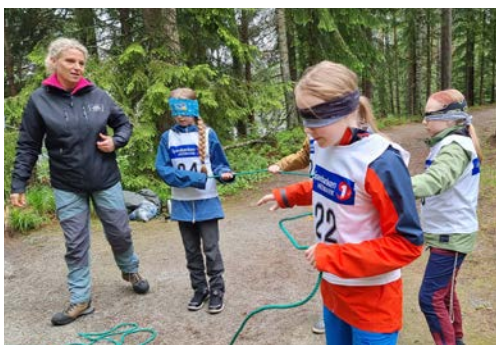
SAMARBEID: På en post skulle deltagerne samarbeide om å lage et rektangel ved hjelp av tau og kommunikasjon med bind for øynene.