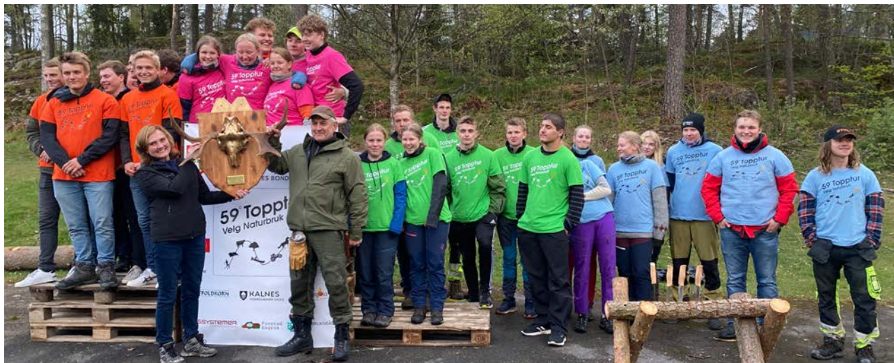
PALLEN: Øverst på (Euro)pallen troner Kalnes vgs. med Det gyldne gevir. De andre finalelagene var Tomb, Kongsberg og Buskerud.