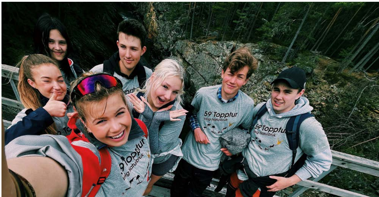
ELVEKRYSSING: Ingen høydeskrekk å spore hos denne gjengen fra Kjeller vgs.