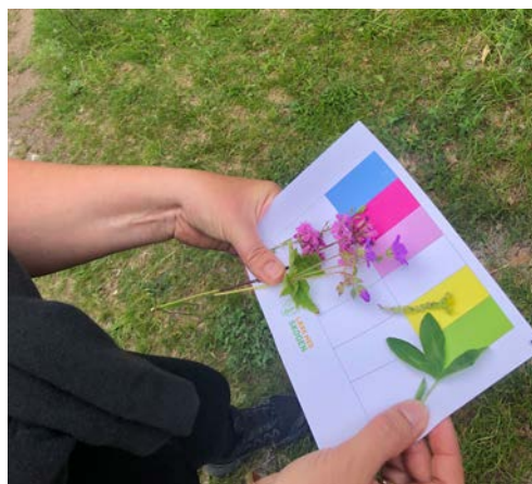
FARGERIK: Kartlegging av biologisk mangfold.

Hittil i år er det gjennomført to seminarer, på Skaret i Møre og Romsdal, og på Breivoll Gård i Ås. I slutten av august er det Norsk skogmuseum på Elverum som står for tur. Seminarerne har vært fulle av engasjerte lærere som setter pris på å få enkle og gjennomførbare verktøy å ta med til skoleklassene, noe som viser et behov for flere av disse samlingene. En dag med praktiske, sanselige og artige oppgaver kan inspirere til å ta disse i bruk i egne klasser, og terskelen for å gjennomføre er lav når en får verktøyene med seg. For Skogselskapets medarbeidere er det en stor glede å få være med å bidra til at enda flere barn kan gjennomføre skoledager utendørs med mer bevegelse, glede og undring. 🌿