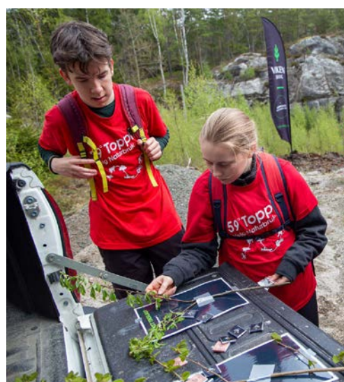
VARIERT: Padling, pelletsbæring og artsbestemmelse var noen av oppgavene.

Etter middagen gjensto kun den store finalen. I finalen var lag fra Tomb vgs, Kongsberg vgs, Buskerud vgs og Kalnes vgs representert i kampen om å bli den beste naturbruksskolen i Viken. I kjent farmen-stil med kniver for riktige besvarelser, omringet av heiarop fra medelever, lærere og inviterte gjester ble en nervefylt kamp avgjort. Til slutt sto Kalnes vgs igjen med flest kniver og kunne heve det gyldne gevir og smykke seg med tittelen årets beste naturbruksskole i Viken.