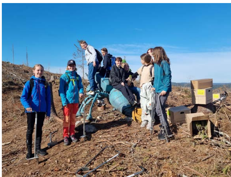
UTEDAG: 280 elever og lærere fikk ny kunnskap om og erfaring med skogplanting, og en fin skoledag ute i det fri.