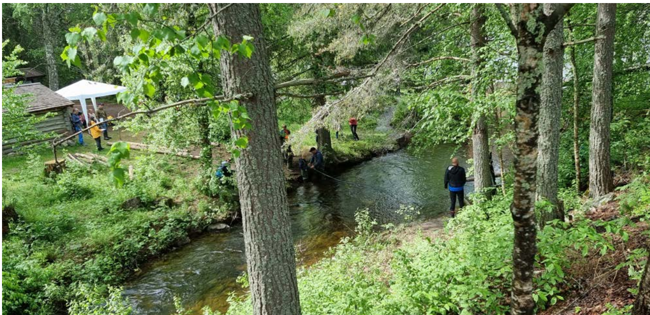
VADING: Deltagerne fikk prøve seg på vading over bekken og kjenne litt på strømmen, med god sikring og veiledning.