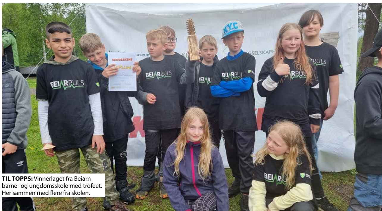
TIL TOPPS: Vinnerlaget fra Beiarn barne- og ungdomsskole med trofeet. Her sammen med flere fra skolen.

TEKST: TORE MOLTEBERG