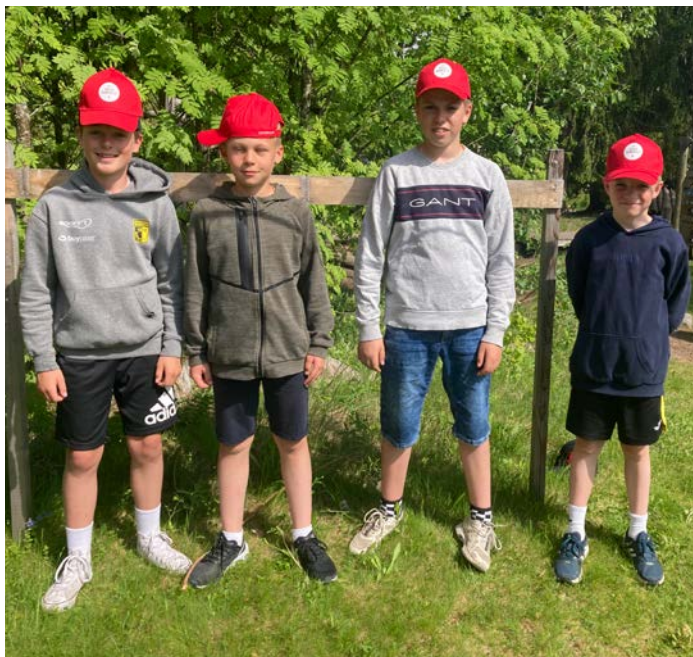
NYUTDANNET: Fire gode skogbrannvoktere.

I finalen skal et firemannslag fra hver av de konkurrerende skolene løse flest mulig oppgaver av praktisk og teoretisk karakter innenfor et tidsrom på tre timer. Det var i år totalt 27 oppgaver. Postene med oppgaver er bemannet med folk fra arrangørene og i år med elever fra Jønsberg vgs på Hamar. Skoglekene er et samarbeid mellom Skogkurs, Anno Norsk Skogmuseum, Hamar naturskole og Skogselskapet.