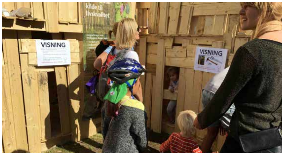
TITTEL: Når man går på visning, må man utforske alle kroker og kriker. På Friluftslivets dag ble ferdigsnekret plankehytte fra skoleskogdagene vist fram for publikum.