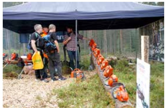
PÅ REKKE OG RAD: Mange motorsagmodeller å velge mellom på Husqvarnas stand.

Skogselskapet grillet burgere og pølser og solgte mat og drikke til alle besøkende. I tillegg hadde Maskinentrepenørenes forening bestilt to helstekte reinsdyr som skulle serveres på entreprenørmiddagen om kvelden, noe som Skogselskapet selvfølgelig tok på strak arm. 480 personer fikk servering i løpet av en halvtime.