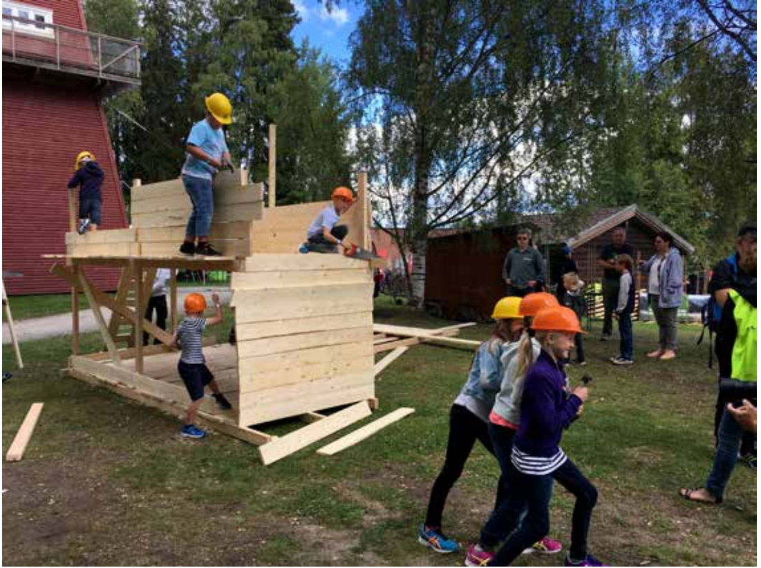
TØFF: Med hjelm på hodet blir man straks en proff snekker og kan enten gyve løs på jobben eller posere for fotografen.