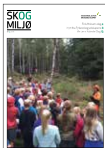
Forsidefoto: Skoleskogdag ved Sognsvann i Oslo.