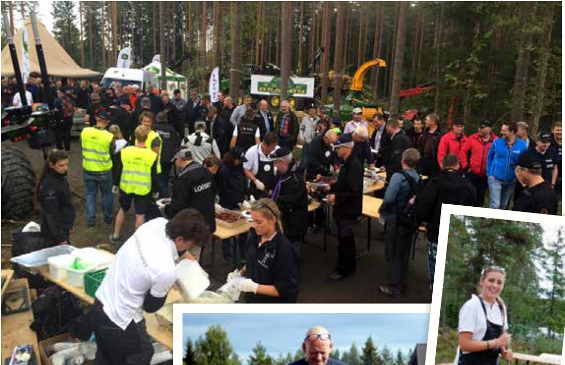
MIDDAG: Om kvelden fikk 480 entreprenører og maskinførere påspandert middag av MEF. Skogselskapet sto for tilberedning og servering.