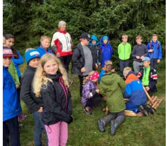
OPPLAND: Elever fra 6. klasse i Vestre Slidre kommune fikk en lærerik skoledag ute i det fri.