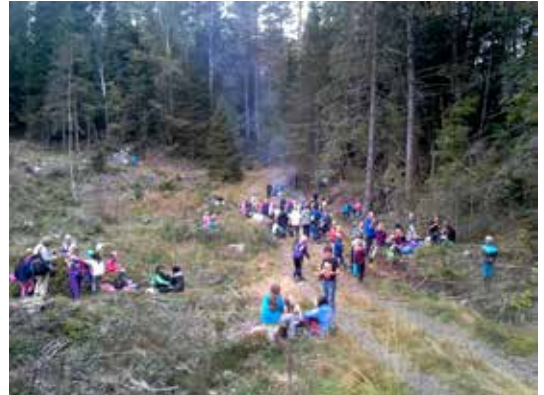
AGDER: Elever fra Froland og Nesheim har deltatt på skoleskog-dager i regi av Skogselskapet.

med spikking og andre aktiviteter. Det var nesten fullt av barn på standen hele helga, og innimellom var det kø. Ungene spikket og produserte nesten like mye flis som fliskutteren som var en del av standen. Ellers var