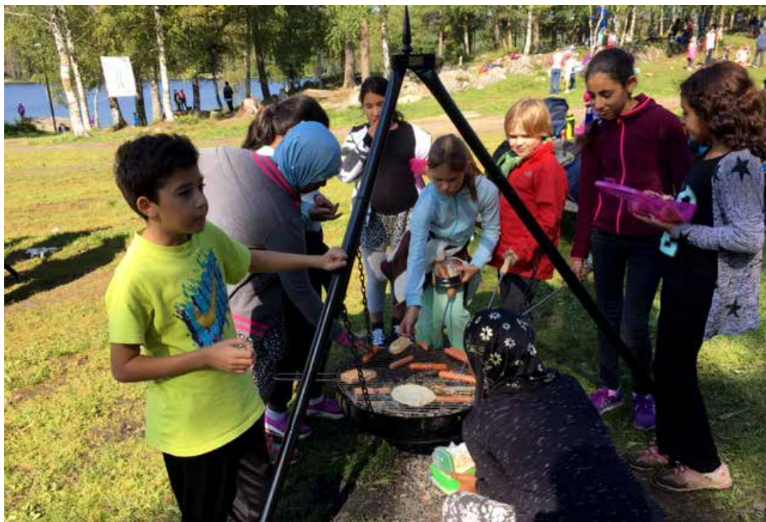
NISTE: Det ble varm lunsj på Oslo-elevene som deltok på Skoleskogdagene på Sognsvann i august.

Arrangørene kunne etter arrangementet konstatere at også flere lærere hadde godt læringsutbytte av skoleskogdagene. Fotosyntesen med CO 2 -fangst, karbonlagring og produksjon av oksygen er dessverre for mange lærere ukjent. Mange hadde også godt utbytte av å høre om hvilke produkter vi får fra trær.