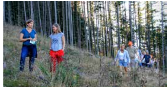
ROGALAND: Ulike skogtypar og utviklingsstrinn ble besøkt på utferda.