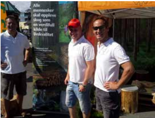
AGDER: Skogselskapet deltok på Arendalsuka sammen med DnS og AT Skog.