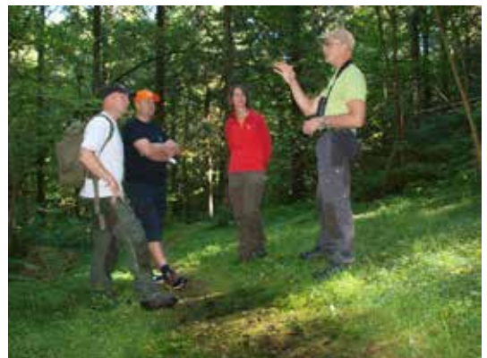
AGDER: Skogselskapet har hatt besøk av Det norske Skogfrøverk og var med på befaring på Lyngdal frøplantasje som ligger på Skogselskapets eiendom i Agder.