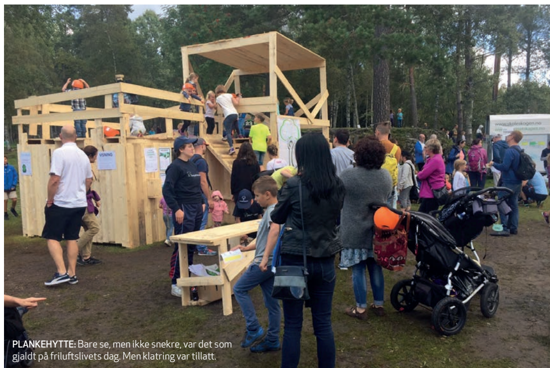
PLANKEHYTTE: Bare se, men ikke snekre, var det som gjaldt på friluftslivets dag. Men klatring var tillatt.

Friluftslivets dag arrangeres av Norsk Friluftsliv i tett samarbeid med medlemsorganisasjonene og andre gode samarbeidspartnere.