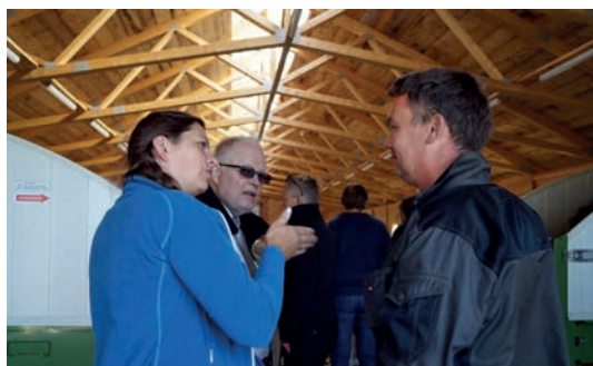
ROGALAND: Trefjøs levert av Riska sagbruk som tåler klimaet på Vestlandet.