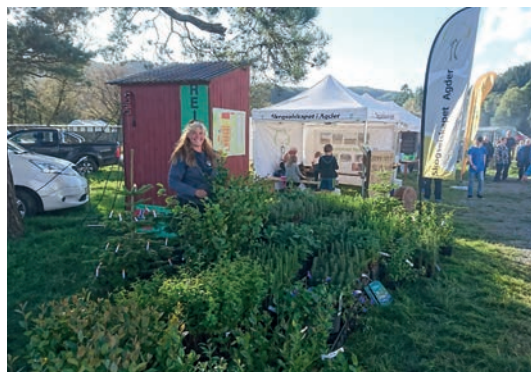
AGDER: På Dyrskuet i Lyngdal viste Skogselskapet i Agder seg fram sammen med Reiersøl planteskole.