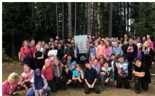
BUSKERUD: God stemning da Hønefoss barneskole hadde skogdag sammen med skogselskapet.

I slutten av august var det skoleskogdag i Modum hvor vi fikk hilse på hyggelige barn fra Stalsberg,