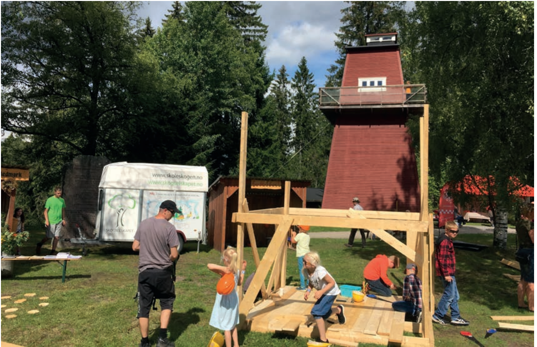
SNEKRING: Alltid populært med plankehytte.