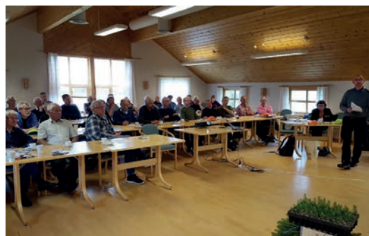
TRØNDELAG: Deltakerne på fagdagen fikk presentert foredrag om frø- og planteproduksjon og om fornyelsen ute i skogen.

Fremtidens skogplanteproduksjon, frømateriale og skogplantenes videre liv i skogen stod i fokus på fagdagen. Den ble innledet med foredrag, og fortsatte med befaring i planteskolen. Under befaringa ble det redegjort for byggeprosess og investering i nytt produksjonsutstyr. Dette ble fulgt opp med demonstrasjon av planteforedlingsarbeid i praksis, og med presentasjon av de aller første forskningsresultatene fra foredlingscenteres virksomhet på Kvatningen. Deltakerne viste stor interesse, og mange fikk svar på kompliserte spørsmål om skogtrærnes «indre» liv.