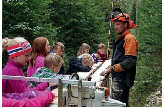
VESTFOLD: Skolelevne fikk se stokker bli til planker på skogdagen på Skjervensletta.

Den årlige skogdagen på Skjervensletta i Lardal for elever og lærere fra 5. trinn ved skolene Efteløt, Hvittingfoss, Hof og Lardal ble gjennomført i begynnelsen av september. Mange flotte elever fikk ny kunnskap om skog og friluftsliv. Efteløt var beste skole i naturstien og fikk andre nappet i vandrefatet. Også elever fra Andebu ungdomsskole har vært på skogdag med skogselskapet.