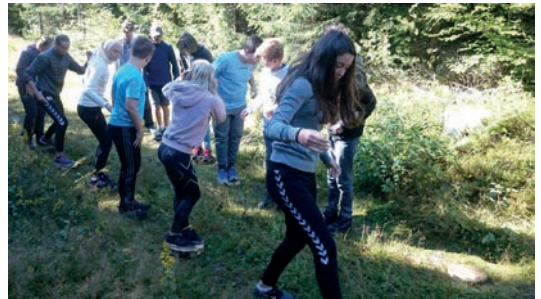
VESTFOLD: Niendeklassinger fra Andebu ungdomsskole i konsentrert gjennomføring av karbonstafett på stammeskiver.