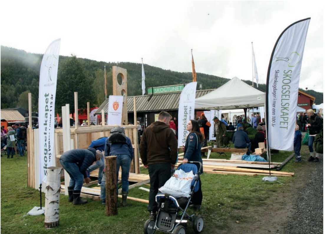
TREBRUK: Plankehyttebygging er moro for både små og store.