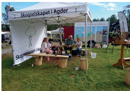
AGDER: Spikking er en trivelig og populær aktivitet på skogselskapets stand.

Naturligvis , som er videreføringen av Landbrukets dag, er den store fagmessa for landbruk og mat i Ag-