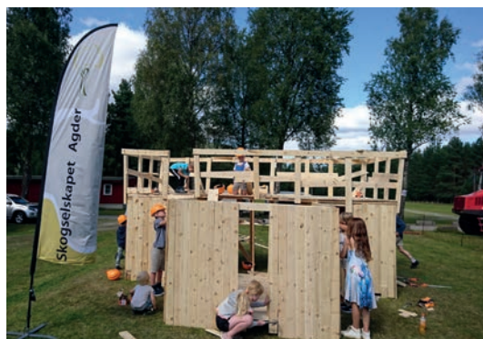
AGDER: Muligheten til å prøve seg som snekker ble benyttet av mange unge og ivrige besøkende på Naturligvis på Evje.