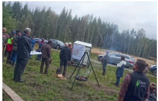
ØSTFOLD: Skogselskapet var en av bidragsyterne da skogeiere i Våler kommune fikk faglig påfyll.

Skogselskapet har vært med å arrangere skogkvelder for skogeiere først i Våler sammen med Våler kommune og Aktivt Skogbruk, og deretter i Rømskog. Temaene var skogbruksplaner, foryngelse, ungskogpleie og tynning. I tillegg var vi innom temaet «når er skogen egentlig hogstmoden?»