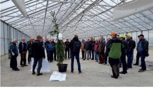
TRØNDELAG: Fagdagen på Kvatningen besto blant annet av befaring i planteskolen. Her ble det redegjort for byggeprosess og investering i nytt produksjonsutstyr.