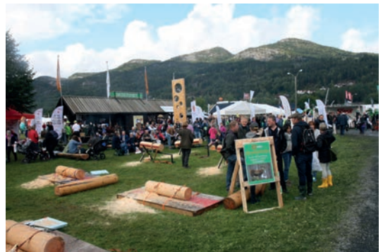
SKOGTUNET: Det var mange aktiviteter for skog- og treinteresserte besøkende.

gående utdanningstilbud. AT Skog, Fylkesmannen i Telemark og Norgesplanter AS er også viktige bidragsyttere på Skogtunet.