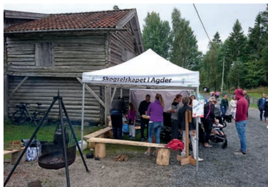
AGDER: Skogselskapet i Agder hadde stand også på Birkelandsdagene.