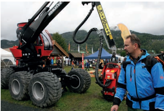
ALLSIDIG: Dyrku'n byr på noe for en hver smak, også til de maskininteresserte.