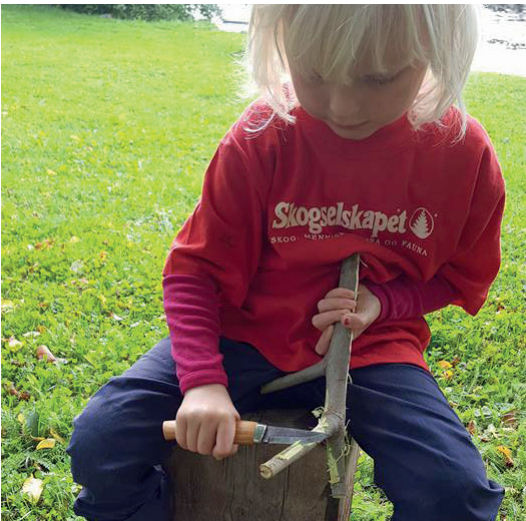
TRØNDELAG: Spikking av knagger var en av aktivitetene på Friluftslivets dag i Steinkjer.

Skogselskapet i Trøndelag har deltatt på stand på både Friluftslivets dag på Holmen i Steinkjer og på landbruksmessa Agrisjå 2017 (se egen sak side 13).