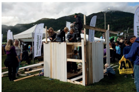
TELEMARK: Det var tett mellom håndtverkerne på plankehytta på Skogtunet under Dyrsku'n.

Skogselskapet i Telemark var prosjektansvarlig for Skogtunet på Dyrsku'n som ble arrangert i Seljord i september, se egen sak side 6-7.