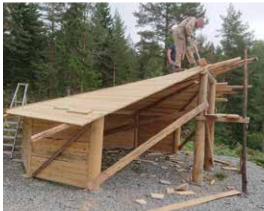
VESTFOLD: Turgåere i nærheten av Konnerud kan nå ta seg en pust i bakken med tak over hodet.

Det var tilslutt Hvittingfoss som stakk med seieren på kunnskapskonkurransen. Takk til medhjelpere fra Viken Skog og lokale skogbruksmyndigheter.