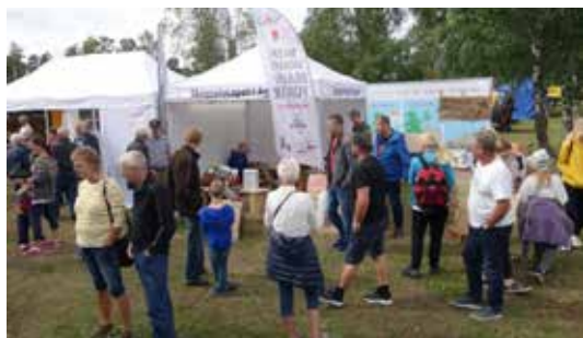
AGDER: Det var folksomt på Naturligvis 2018 på Evje.

For voksne og ungdommer rettet vi oppmerksomheten mot våre prosjekter: Velg Naturbruk, Førstehjelp for nye skogeiere, Økt verdiskaping for trebasert næringsliv, og sist, men ikke minst generelt informasjonsarbeid om skog til allmenheten. Vi gjennomførte også en trekonkurranse som pågikk hele helga.