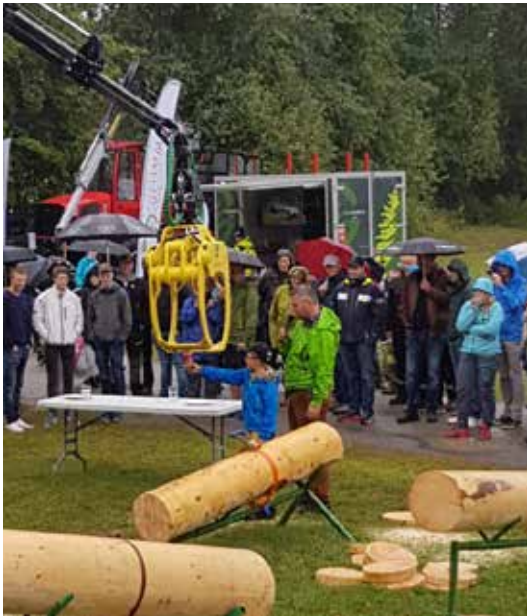
HEDMARK: Mating av lassbærer var mulig på Jakt- og fiskedagene.

De nordiske jakt- og fiskedager er over, etter fire dager i Elverum. Nesten 30 000 personer har vært innom på arrangementet, tross to dager med uheldig vær. Mange trivelige folk har også tatt turen innom «skogbrukstunet», fått seg en kopp kaffe, og slått av en prat. Det har vært motorsag-show, lassbærer-show, debatt, helgrilling av villsvin og mye annet gøy. Vi gleder oss allerede til neste år!