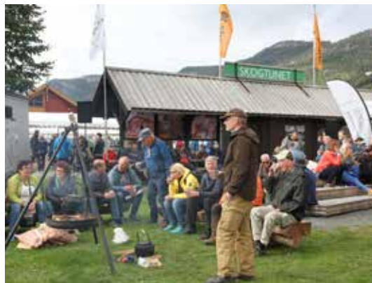
BÅLSTEMNING: Det var god stemning på Skogtunet på Dyrsku'n. Publikum koste seg med bålcaffe og en pust i bakken.

Tett på matsserveringen stod Komatsu med en lassbærer full av tømmer og det betimelige quiz-spør-