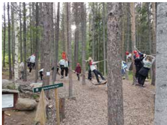
HELGELAND: Lek og moro i Naturklatrejungelen.