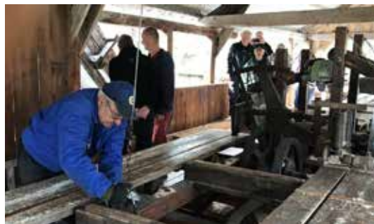
OPPLAND: Sagelva vasskraftsenter og Skogselskapet har startet opp et samarbeid for videreutvikle senteret.

Lørdag 11. august var Sagelva vasskraftscenters nye samarbeidspartner på Bjorli på besøk, og sammen