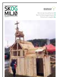
Stavkirke i plankehytteformat laget av skogstudenter fra NMBU og snekkerinteresserte barn på Dyrsku'n i Seljord.