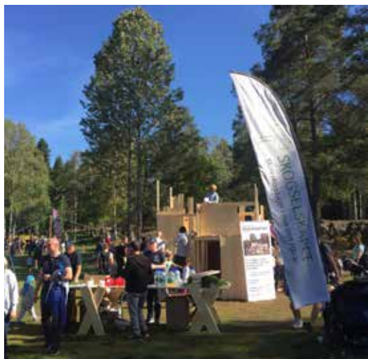
FOLKSOMT: Osloborgerne er ikke vonde å be når sola skinner og områdene rundt Sognsvann er fulle av aktiviteter.