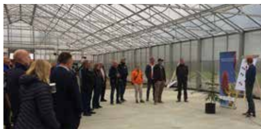
NY ÆRA: Fra nå av kan skogplanteforedlerne selv bestemme når grana skal blomstre på Kvatninga. Den 16. august ble anlegget offisielt åpnet.

Hjorth forteller at for anlegget på Biri er byggeprosessen helt i startfasen nå. Der skal det settes opp et nytt bygg fra grunnen av, mens det på Kvatninga er snakk om et leieforhold av eksisterende drivhus og utearealer.