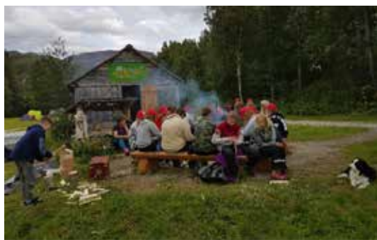
HELGELAND: Fullt fokus når det spikkes

ble det opprettet en klangstue og en planteskole for å kunne bruke lokalt plantemateriale da de fant ut at materialet fra Rogaland ikke passet helt med klimaet nord for Saltfjellet. Vi ser altså allerede her linjene for dagens moderne skogbruk. Ikke bare i Nord-Norge, men for hele Norge. En næring som endrer seg i takt med fornyet og tilegnet kunnskap. I dag er skogvoktergården blitt til en moderne hytte i regi av Statsskog, og rundt den er det opprettet et arboret. Sammen med Nordland nasjonalparksenter har det blitt et flott reisemål for både små og store. På samlingen fikk 4H-erne brynet seg på både natursti og spikking, og i tillegg gjennomgikk de quizen slik at de kunne bli en skogens brannvokter. Vi hadde inntrykk av at barn og unge i 4H hadde en fin dag.