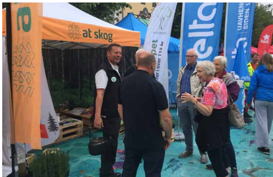
SKOGSTAND: Arendalsuka samler mange engasjerte mennesker som gjerne tar en prat om skog og skogbruk.

Arendalsuka arrangeres hvert år i uke 33.