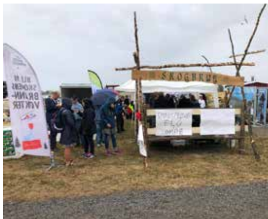
ØSTFOLD: Skogselskapet bød på smaksprøver av skogens konge i ruskevær på Markens Grøde.

Skogselskapet hadde stand med helgrilling av elg og utdanning av Skogens brannvoktere på Markens Grøde i Rakkestad den andre helga i august.