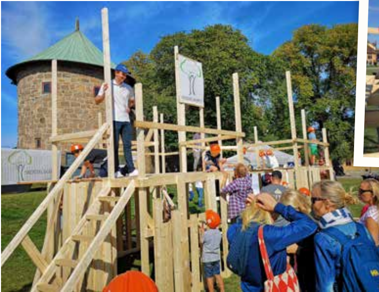
BYGGVERK: Ikke verdens høyeste trehus, men antakelig et av de kuleste reiste seg på Akershus festning ved hjelp av mange flittige snekkerspirer.

NYTTIG VERKTØY: Begge sider av hammeren kom til nytte for denne arbeidsgjengen.