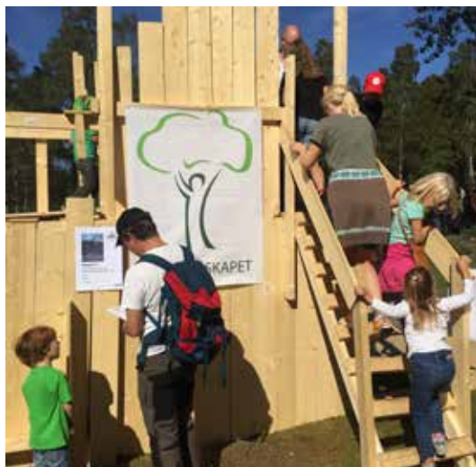
FERDIGHUS: Bare se, men ikke snekre for barna på Friluftslivets dag.