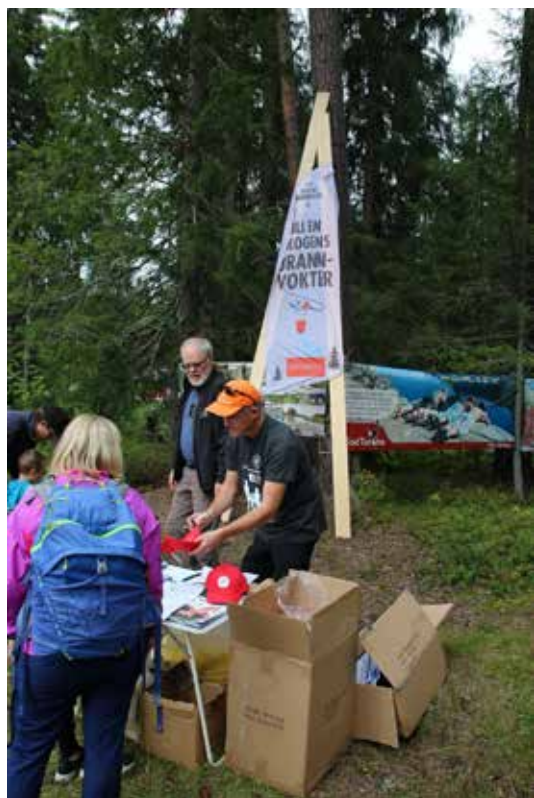
TRØNDELAG: Skogselskapet stilte med en post hvor 175 nye skogbrannvoktere ble utnevnt.

Skogens brannvoktere var skogselskapets aktivitet i år. Det var populært. 175 nye brannvoktere med rød caps inntar nå Trondheim. Forsikringsselskapet Skogbrand står bak Skogens brannvoktere.