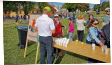
VÆSKEPÅFYLL: Skogselskapet sørget for væskebalansen for besøkende på festningen.