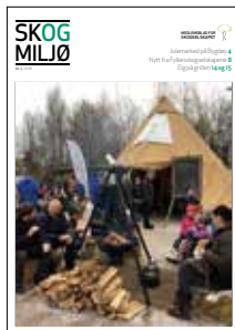
Forsidefoto: Julemarked på Bygdøy.