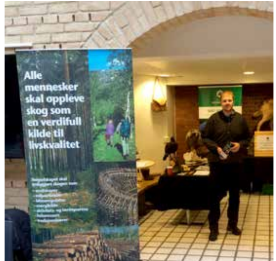
STAND: Skogselskapet og Norsk Skogmuseum presenterte seg for grunnskolelærerne i tradisjonsrike omgivelser.

Frydenlunds bryggeri ble for øvrig etablert av Mads Langaard i 1859.