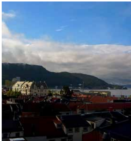
TRØNDELAG: Skogselskapet i Trøndelag har fått nye lokaler, og er spredt på fire ulike steder. Lokalene i Trondheim har spesielt fin utsikt.

I Trondheim er vi faktisk tilbake i Bøndenes Hus etter en lengre rundreise med staten. Her har vi panoramautsikt mot de gjenreiste skoger i Bymarka. Vi har Ol Trøndersk Mat og Drikke, 4H, Bondelaget, Senterpartiet og en gjeng fra Rørosmatmiljøet på