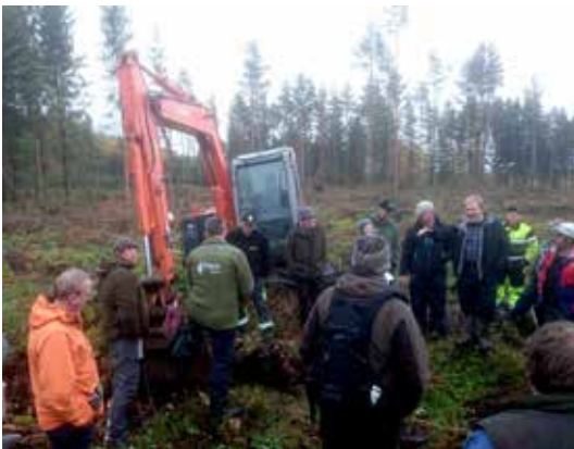
ØSTFOLD: Diskusjon om markberedningsflekker under fagdag om markberedning.

Nesten 30 personer møtte opp i Haslem skog i Rak-