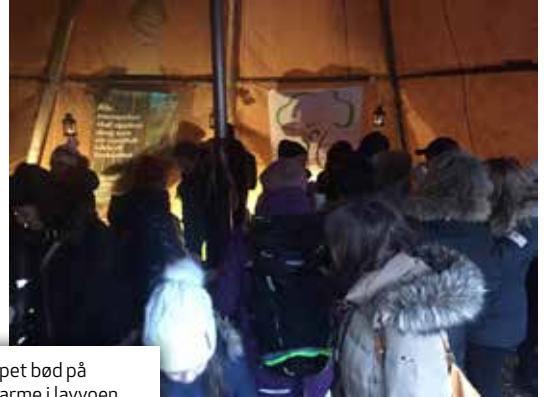
VARME: Skogselskapet bød på varme i koppen og varme i lavvoen, og en skogprat på kjøpet.