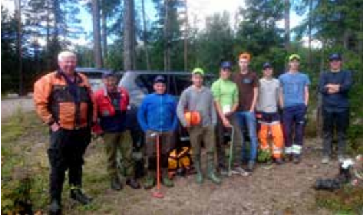
ØSTFOLD: Instruktører og deltagere på skogkurs for ungdom.

teori og praksis, har ungdommene fått dokumentert opplæring og inspirasjon til å stelle framtidsskogen.