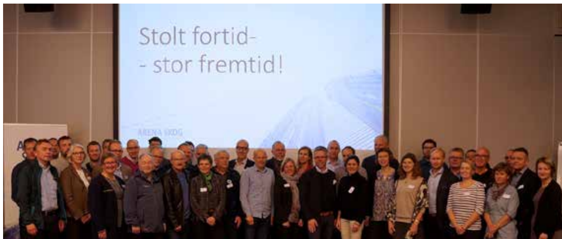
TRØNDELAG: Oppstartskonferansen for Arena Skognæringa i Trøndelag samlet over 60 deltagere.