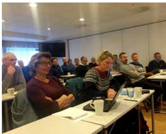
DELTAKERE: De fleste fylkesskogselskapene var representert.