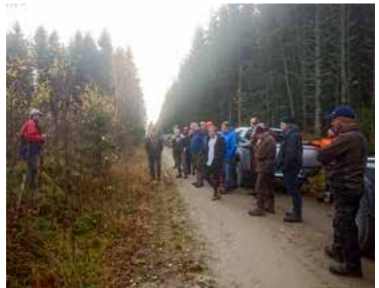
ØSTFOLD: Lauvskogskjøtsel under fagdag om ungskogpleie.