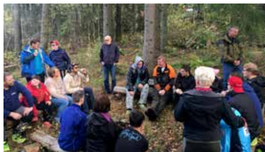
OSLO OG AKERSHUS: – Hvor skal vi plassere gapahuken? God deltagelse på planleggingsmøtet!

Denne høsten har vi i Skogselskapet i Oslo og Akershus hatt et ekstra givende prosjekt. I samarbeid med Drømtorp videregående skole i Ski har vi startet arbeidet med å etablere et uteskoleområde spesielt tiltenkt elever med tilrettelagt opplæring. Ekstra