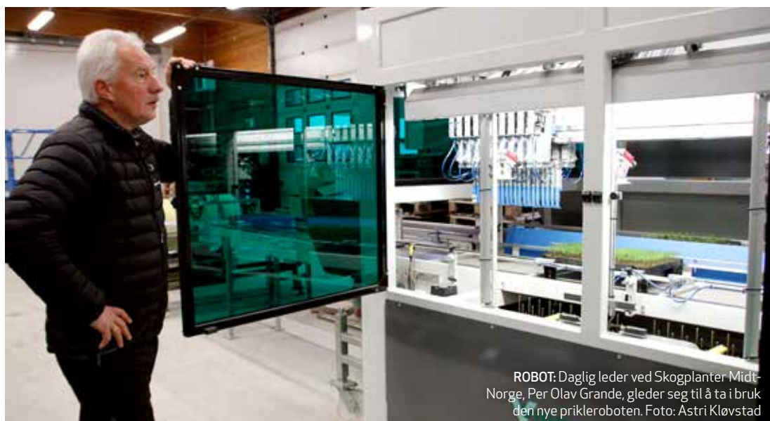
ROBOT: Daglig leder ved Skogplanter Midt-Norge, Per Olav Grande, gleder seg til å ta i bruk den nye prikleroboten.

inn en ny komplett sålinje og ikke minst ny priklerobot for mikroplanter. Dette er nødvendig for å legge om til en mer effektiv arealutnyttelse og produksjon. Det er også framført ny strømforsyning til planteskolen i Kvatninga med ny jordkabel og trafohus med 400 volt industristrøm. I tillegg faser man ut oljefyrt oppvarming til veksthusene og satser på elektrisk oppvarming. Takene på det nye produksjonsbygget og det eldre produksjonshuset er belagt med solceller for produksjon av solkraft. Total kapasitet på solkraftanlegget er 100 kW. Denne kraften brukes til ordinær drift og til oppvarming av veksthus. Overskuddskraft leveres til nettet.