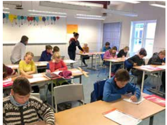
OPPLAND: Første time av skoleskogdagen foregår inne.

En slik dag foregår slik: Først en time inne med lære om skog, klima og lokalt skogbruk, osv deretter ut i nærskogen/skoleskogen og bli kjent med den. Vi ønsker at elever og lærere skal drive fysisk aktivitet og samtidig lære matte, naturfag, samfunnsfag osv. Og på den måten få et godt forhold til skog og samtidig oppnå god folkehelse. Opplegget er forankret i lærerplaner for vært enkelt trinn.