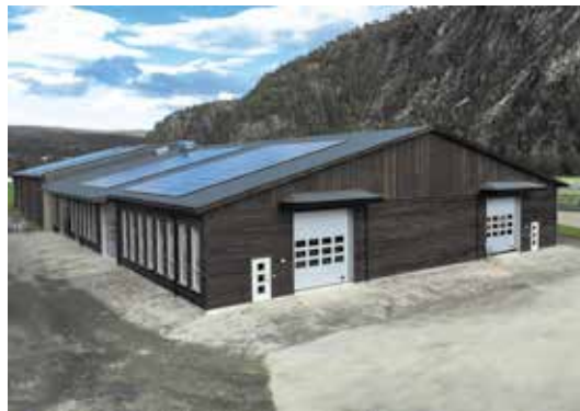
TRØNDELAG: Et nytt trebygg med solceller på både nye og gamle tak. Kvatningen er blitt et av Trøndelags viktigste anlegg for utvikling av biomasseproduksjon og bioøkonomi.