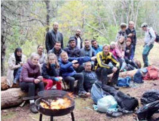
HORDALAND: Unge og voksne elever på skogdag i Ulvik.

Velg Skog arrangerte dagen i samarbeid med Vestskog, Trå og Velken entreprenører, skogbruksjefene i begge kommuner, samt det lokale skogeierlaget. Skogeieren kom også innom og fortalte om drifta og om hvordan de ville holde skogen tilrettelagt for friluftsliv.