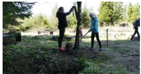
VESTFOLD: Drep rotta! – er en lek som utfordrer reaksjonsevnen. Denne og andre aktiviteter fikk behørig omtale på Skogsforum.se i slutten av november.