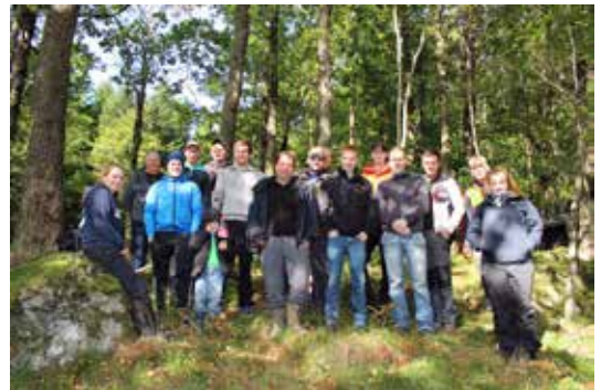
ROGALAND: Deltakere på skogdag for skogeiere i Bjerkreim - som var en del av en ny satsing fra Kystskogbruket.