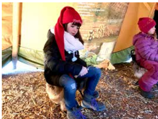
SPIKKING: Skogselskapet vil la neste Tre om Tre-prosjekt handle om spikking.

TEKST: TROND LOHRE