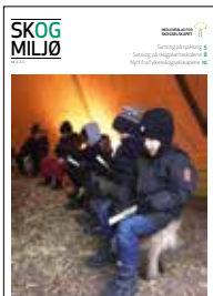
Forsidefoto: Mange barn lot seg oppsluke av spikking på Julemarkedet på Bygdøy.