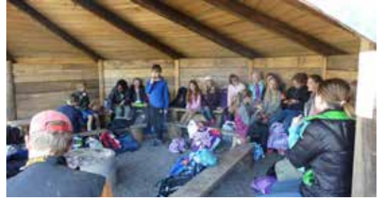
VESTFOLD: 41 elever fra 1. til 7. trinn på en barneskole i Sandefjord deltok på skoleskogdagen som hadde besøk fra Sverige

måten oppleves en stor variasjon i vekst og vekstformer. Vi har møtt på alt fra buskformer, slangegraner, kvistbuser til rettvokste og vekstkraftige kvalitetstrær. Gran er absolutt individer på linje med andre skapninger. I nærkontakten har de blitt omtalt med både rosende og mindre rosende ord.