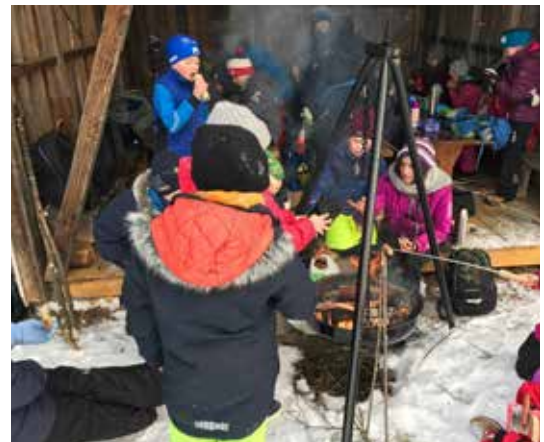
OPPLAND: Femte trinn på Aurvoll skole i Øyer Kommune på skoleskogdag