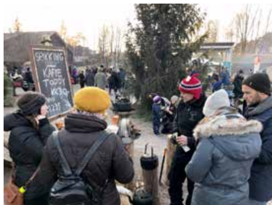
MODERNE: Kaffe ble kokt både over vanlige bålpanner og på de høyteknologiske Biolite-ovnene som lader mobiltelefonen samtidig som kaffen kokes opp.

Skogselskapet setter stor pris på det gode samarbeidet som er utviklet med Norsk Folkemuseum. Dette er en flott arena for å nå ut til allmennheten med de budskapene som Skogselskapet står for. Vi ser derfor frem til et fortsatt godt samarbeid med Folkemuseet i tiden fremover.