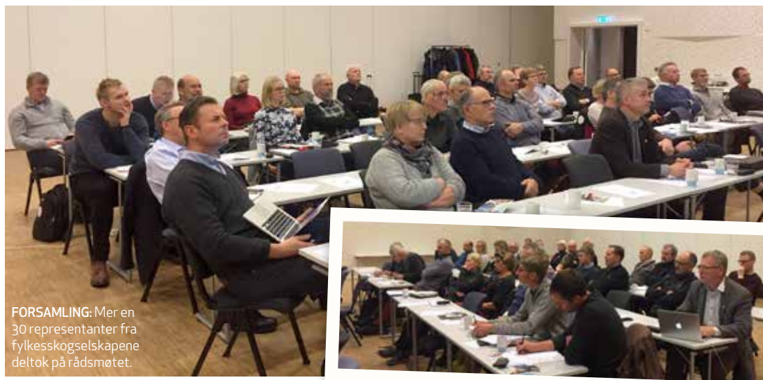
FORSAMLING: Mer en 30 representanter fra fylkesskogselskapene deltok på rådsmøtet.