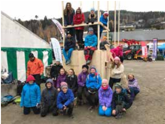
OPPLAND: Det var stor byggeaktivitet på Stavsmartn.

lærer om skogens rolle i klimasammenheng og hvor viktig skogen er for næringsutvikling i bygda. I tillegg er det et råstoff som er klimanøytralt å bygge i.