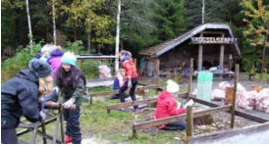
VESTFOLD: Skoleskogdag med elever fra Mokollen skole.