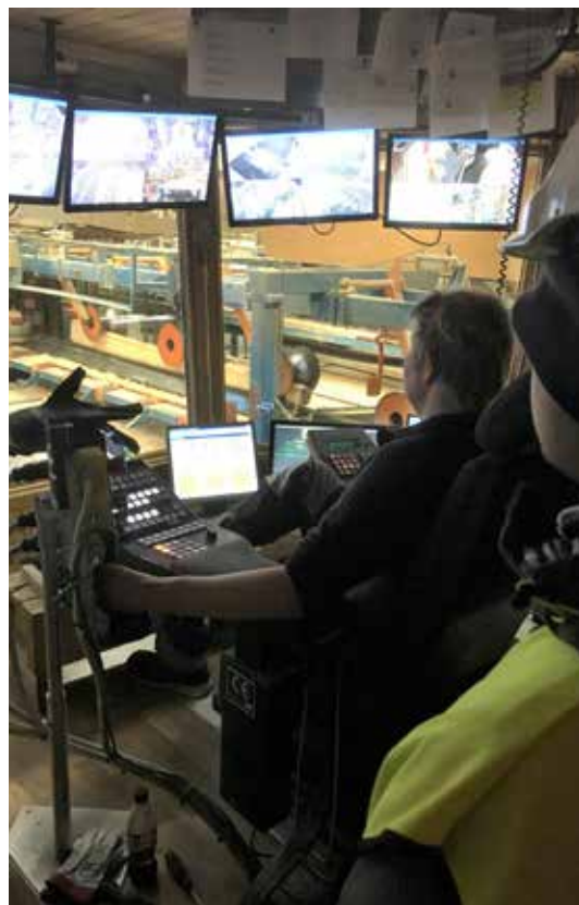
TRØNDELAG: Omvisning hos Kjeldstad Trelast ga innblikk i også den delen av verdikjeden.

Rekrutteringsskogdag er et eksempel på aktivitet som har grunnlag for å bli et varig tiltak eller arrangement. Tidligere i høst inviterte prosjektet i samarbeid med Allskog SA og skogeierlagene i Selbu og Tydal til en skogdag på eiendommen til Thomas Angels Stiftelser i Selbu. Over femti elever fra ungdoms- og naturbruksskoler i distriktet deltok sammen med et tjuetalls skogeiere fra distriktet. Alle fikk et godt innblikk i flere ulike tema; hogst og drift, planting, ungsogpleie, en lærlings og skogbruksleders hverdag, miljøkrav i skogbruket, bruk av drone i moderne skogbruk og selvsagt behovet for kompetanse og rekruttering til næringa. Tid ble det også til omvisning og informasjon ved Kjeldstad Trelast AS avdeling Selbu. Med andre ord en innholdsrik og lærerik dag, som forhåpentlig gir inspirasjon til videre karriere innen skog- og trenæringa!