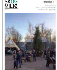
Skogselskapet som vanlig til stede på det tradisjonsrike julemarkedet på Folkemuseet i Oslo.