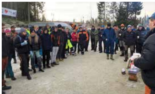
TRØNDELAG: Over 50 skogkurs- og naturbrukselever fra Støren, Selbu, Øya og Skjetlein deltok sammen med mange skogeiere fra distriktet på rekrutteringsskogdagen i Selbu.

Rekruttering til relevant yrkesfaglig og høyere utdanning er det viktigste innsatsområdet i prosjektet. Utover dette legges det vekt på generell informasjonsvirksomhet samt utvikling av rekrutterings tiltak med varighet utover prosjektperioden.