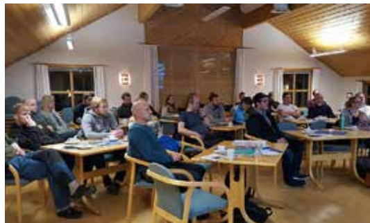
TRØNDELAG: Det er håp om økt aktivitet i skogen etter at 36 nye skogeiere deltok på kurs i regi av Skognettverket i Namdal og Skogselskapet i Trøndelag.

I løpet av to kurskvelder tar vi for oss sentrale tiltak i skogens omløp som bringer frem en robust og