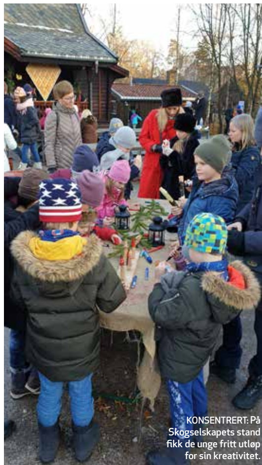
KONSENTRERT: På Skogselskapets stand fikk de unge fritt utløp for sin kreativitet.

og opplevelser for hele familien. Skogselskapet stilte med stor lavvo, bålpanner, sittegrupper med reinsdyrskinn og hadde blant annet spikkeverksted, bålcaffe og solbærtoddy. Nytt av året var i tillegg spesialvafler til de besøkende. Dette i tillegg til god stemning og informasjon om skogens betydning i spesielt ny - men også gammel tid. Spikkeverkstedet er en meget populær aktivitet hvor det blant annet er mulig å spikke trenisser med kyndig veiledning og gode råd til både små og store.