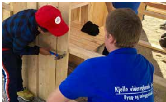
OSLO OG AKERSHUS: Ung mann instruerer enda yngre mann i snekring.

I tillegg ble det delt ut mange skogplanter som nå skal fange mengder av CO 2 i hager og lignende. Utalige bålkafeer har også blitt drukket, og ikke minst har en drøss av trivelig skauprat funnet sted rundt bålpanna.