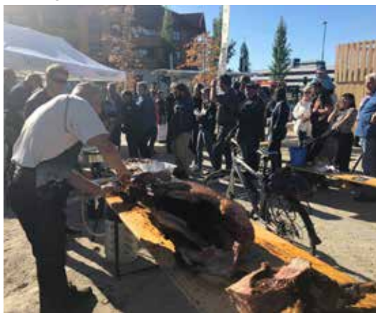
OSLO OG AKERSHUS: Lang kø for å smake på stuttreist og himlaga helstekt villsvin på Bjørkelangen.

Arrangementet fant sted på Bjørkelangen i slutten av september. På skogtunet var hovedattraksjonen smaksprøver av helgrilla villsvin. Det må ha falt i smak, over 800 smaksprøver ble delt ut til glede for store og små.