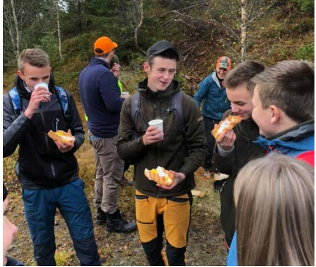
FØRING: Elevene ble føret godt med både mat og kunnskap.

Til Rogstadmarka ved Støren kom 100 elever og lærere fra 10. klasse ved Rennebu, Støren, Selbu og Tydal ungdomsskoler samt naturbruksklasser fra både Øya og Skjetlein videregående skole. Her fikk de demonstrert bruken av drone til ulike skjøtselstiltak i skogbruket, hvordan en planlegger en skogsdrift med riktige miljøsyn og hvorfor vi utfører ungskogpleie samt hvilken effekt det har. Videre ble de selv sagt føret opp med pølser, wienerbrød, kaffe, saft og en masse informasjon om hva skog og tre har å by på. Her fikk ungdommen en masse inntrykk som bør kunne motivere til å tenke videre utdanning og karriere innen skog- og trebruk.