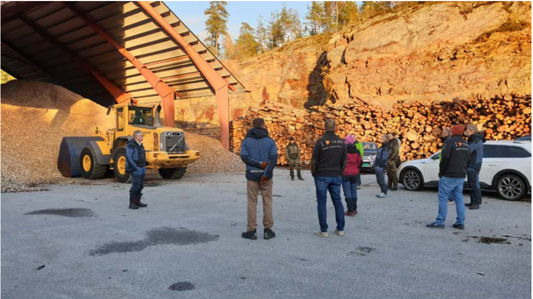
BIOENERGI: Deltakerne fikk også med seg en omvisning på Skogselskapets eiendom i Østfold, her på flisterminalen.

heldags for flere klassetrinn, eller mer kortvarige for enkelttrinn. Begge deler fungerer godt for Kirkeng skole. De gode tilbakemeldingene og erfaringsutvekslingen ga en fin motivasjon for å videreføre vårt vellykkede opplegg med skoleskogdager også i tiden framover.