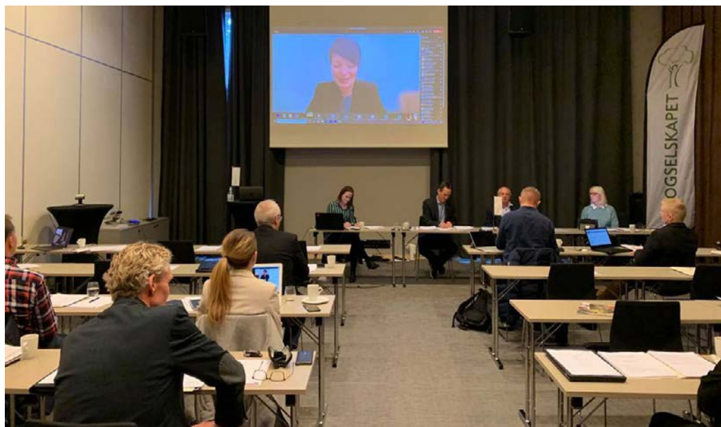
PÅ KORONAVIS: Den nye styrelederen deltok, som en del andre, på landsmøtet via skjerm. De som var til stede satt langt fra hverandre.