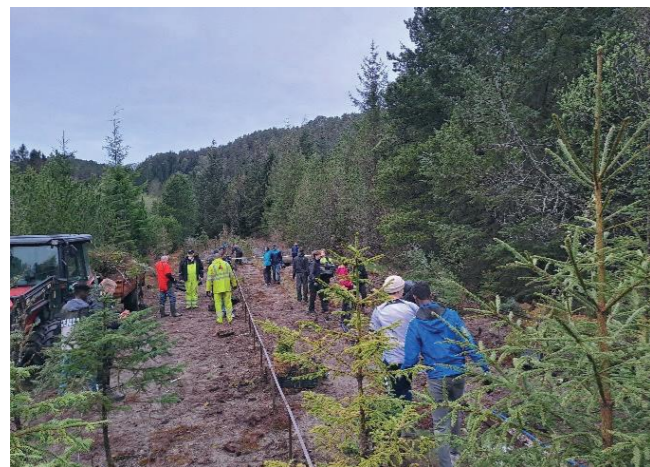
Frå dugnad i mai.

Inni driftsbygninga har golfklubben oppgradert loftet med golfsimulator og starta på arbeidet med klubblokale for sine medlemmar. I samband med dette har det blir rydda ein del innandørs.