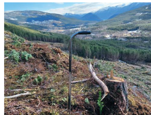
Plantefelt frå Kaupanger.

Skogkulturaktiviteten hadde i 2023 ein liten nedgang samanlikna med 2022, som i førre årsmelding blei omtala som eit rekordår for skogkultur i Vestland. Nyplantingstal og ungskogpleie gjekk ned noko, og for heile fylket blei det satt ut 1 456 060 planter i nyplanting, 71 895 planter i supplering mot høvesvis 1 586 299 og 74 755 planter førre året. Areal med ungskogpleie passerte så vidt 1000 daa i 2023 mot 1456 i 2022.