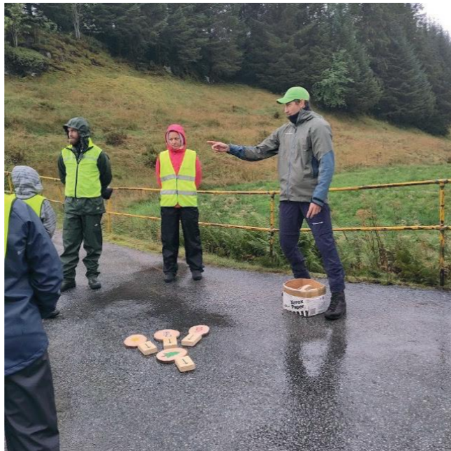
Frå plantedagen med Stavang skule.

På seinhausten vart folkehøgskular og vidaregåande skular i fylket besøkt for å formidle om utdanning- og karrieremoglegheiter i skogbruket på Vestlandet.