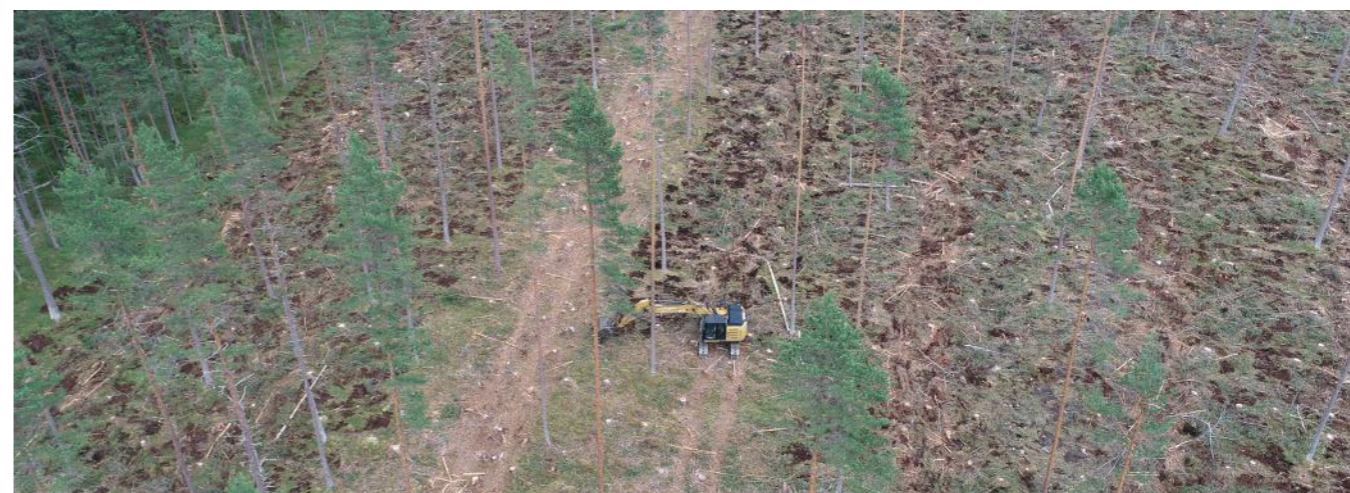
Markriving på Kaupanger.

For Sogn og Fjordane utgjorde nyplanting og suppleringsplanting knapt 657 000 planter, nesten 100 000 planter færre enn i 2022. Men det blei satt ein ny rekord på markriving i gamlefyllket på 611 daa i 2023, i all hovudsak på Kaupanger. Næraste samanliknbare tal eg har funne på markriving var i 1996 med 570 daa, eit år det var fokus på markriving jamfør årsmeldinga til Skogselskapet. Markrivinga på Kaupanger blei gjort noko seint då nokre av konglane hadde opna seg og sleppt frøa, men tal frøtre og utføringa av arbeidet såg bra ut, så det blir spanande å sjå om det spirer i flekkane med små furuplanter.