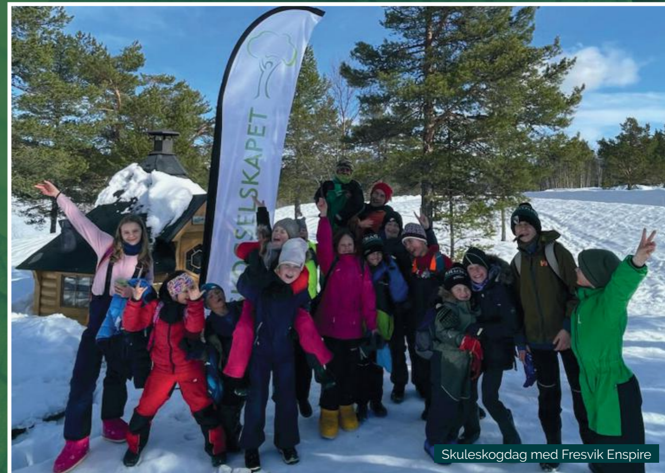
Skuleskogdag med Fresvik Enspire