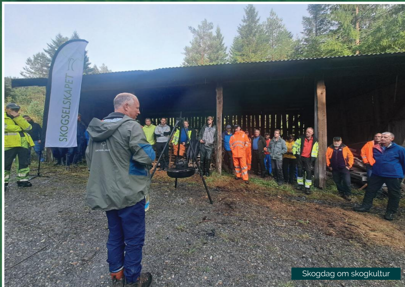
Skogdag om skogkultur