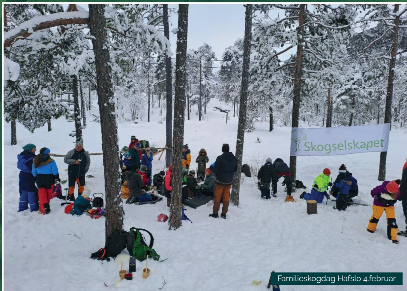
Familieskogdag Hafslø 4. februar