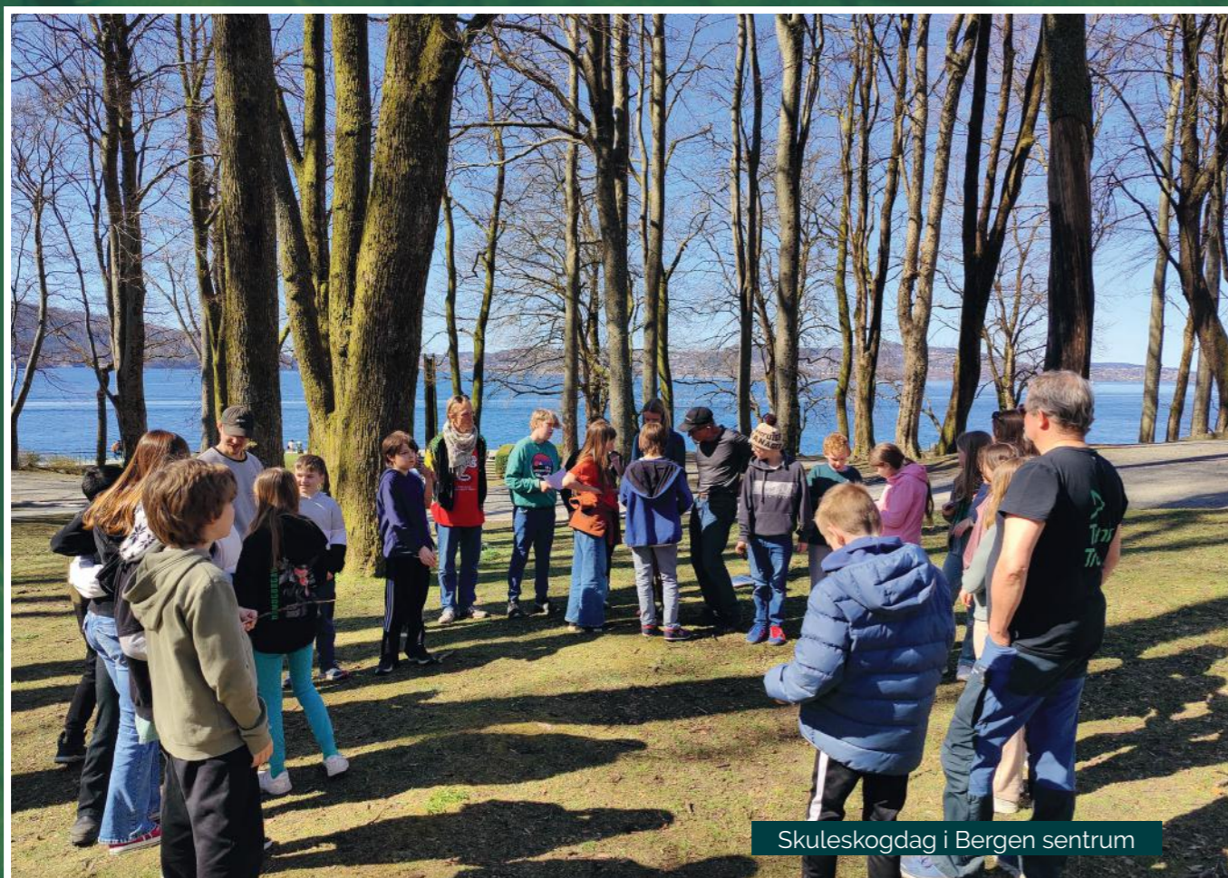
Skuleskogdag i Bergen sentrum