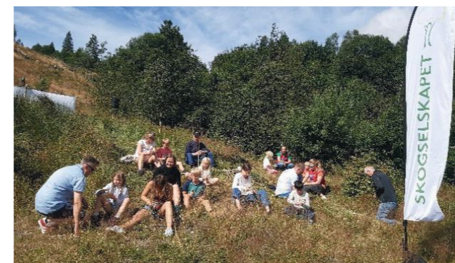
Stubbekonsert med familiedag i Dale.

I løpet av sommarhalvåret vart det arrangert 3 stubbekonsertar med familieaktivitet i Sogn, Sunnfjord og Nordfjord, med til saman 230 deltakarar.