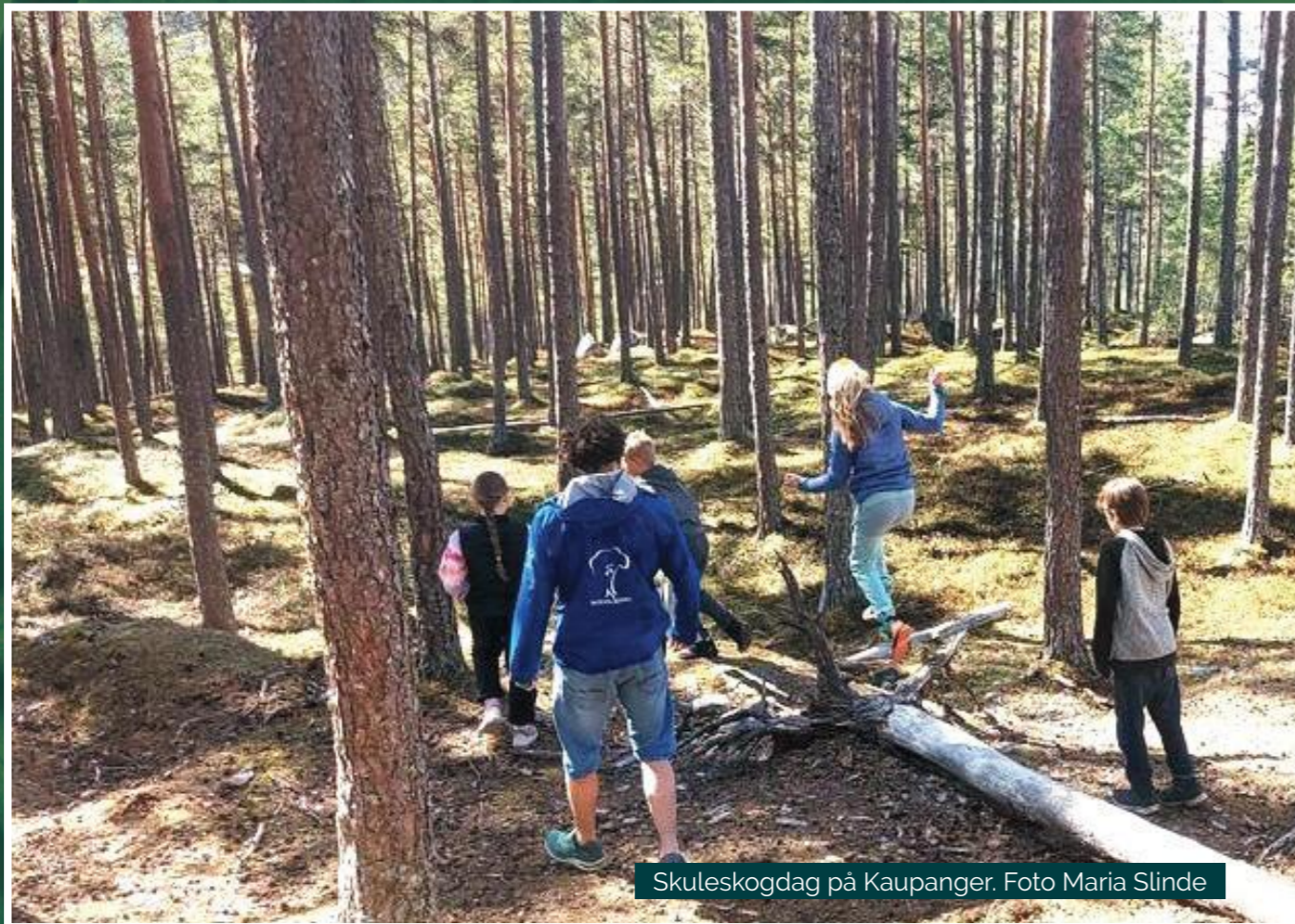
Skuleskogdag på Kaupanger.