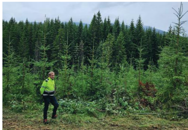
Superbonitet på Hafslo.