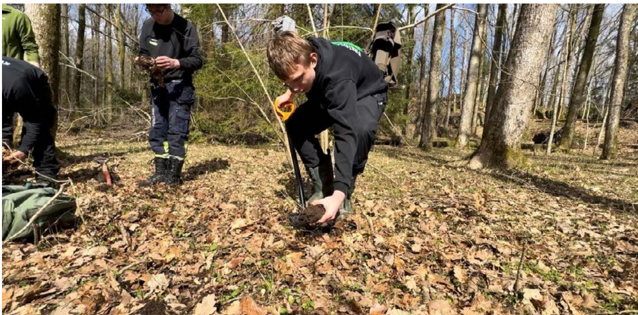
Elevene fra KVS-Bygland spar opp eikeplanter fra et område og flytter til et annet.