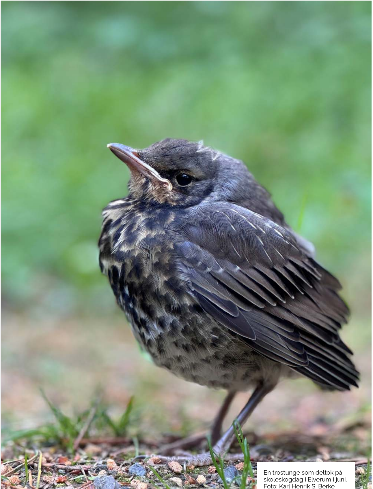
En trostunge som deltok på skoleskogdag i Elverum i juni.