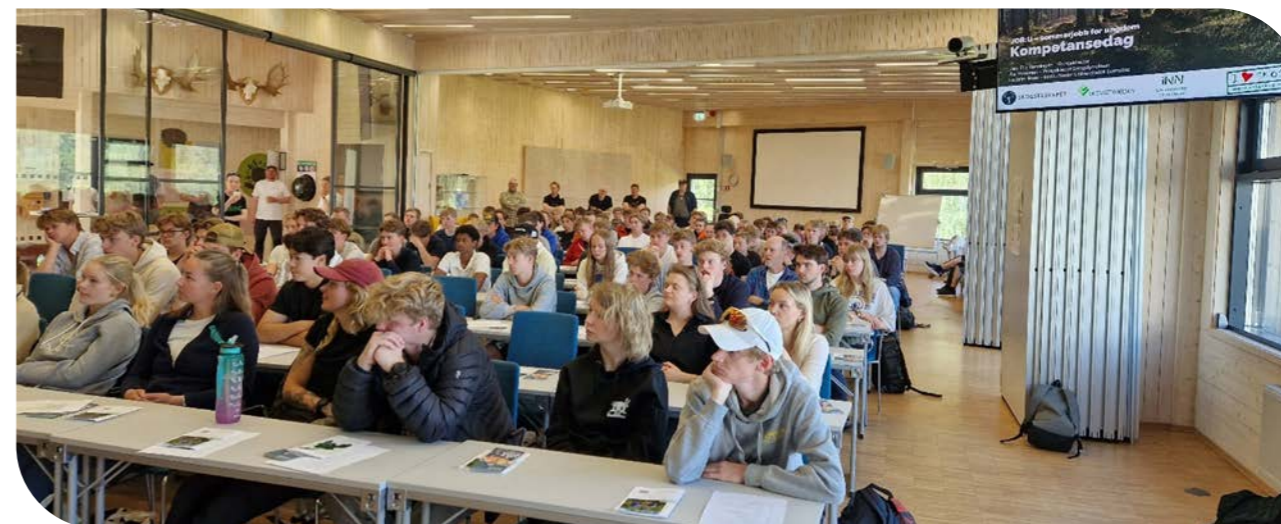
Kompetansedag på Evenstad.

I 2021 skisserte Skogselskapet i Hedmark et 5-årig JOB:U-prosjekt. Med god støtte fra næringsaktørene Glommen Mjøsen, Stora Enso og SB Skog har prosjektet blitt realisert i årene 2021-2024. Prosjektet har vært avhengig av støtte både fra det offentlige og næringen. Fra det offentlige har Innlandet Fylkeskommune og Statsforvalteren i Innlandet