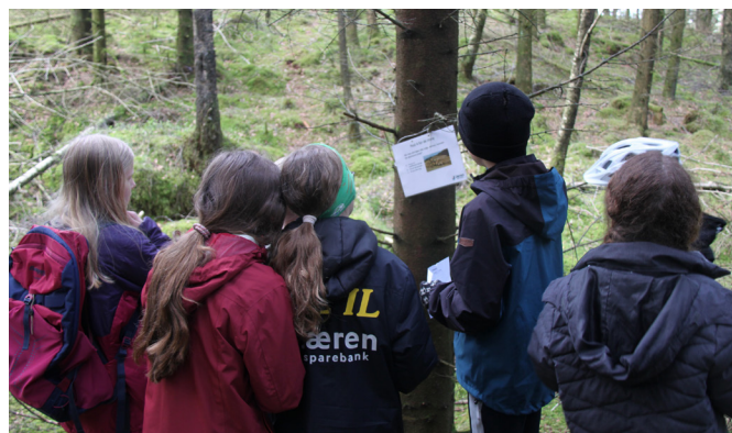
Konsentrerte elevar på natursti-post under skuleskogdag i Njåskogen.