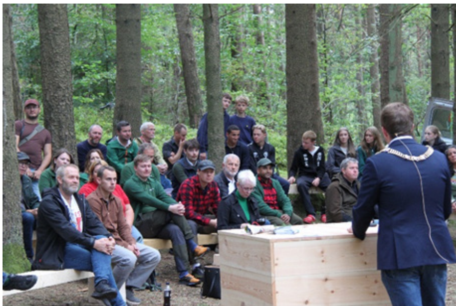
Onsdag 27. august arrangerte forumet ein skogdag for politikarar i Sørmarka i Stavanger.

Rogaland skognæringsforum er såleis eit ledd i utviklinga av det ganske unike nettverksamarbeidet Kystskogbruket.