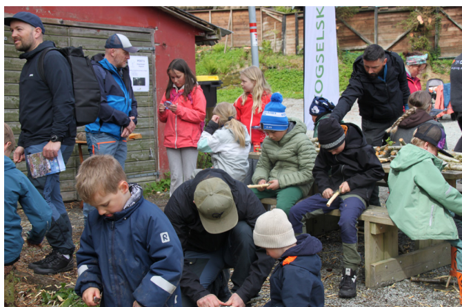
Skogselskapet sitt spikkebord er mellom dei mest populære innslaga under Naturdagen ved Stokkavatnet.

Kontaktinformasjonen din kan enkelt oppdaterast ved å sende ein e-post til rogaland@skogselskapet.no , eller du kan ta kontakt på 973 00 095. For utsending av medlemsbladet Skog og miljø per post trengs oppdatert postadresse.