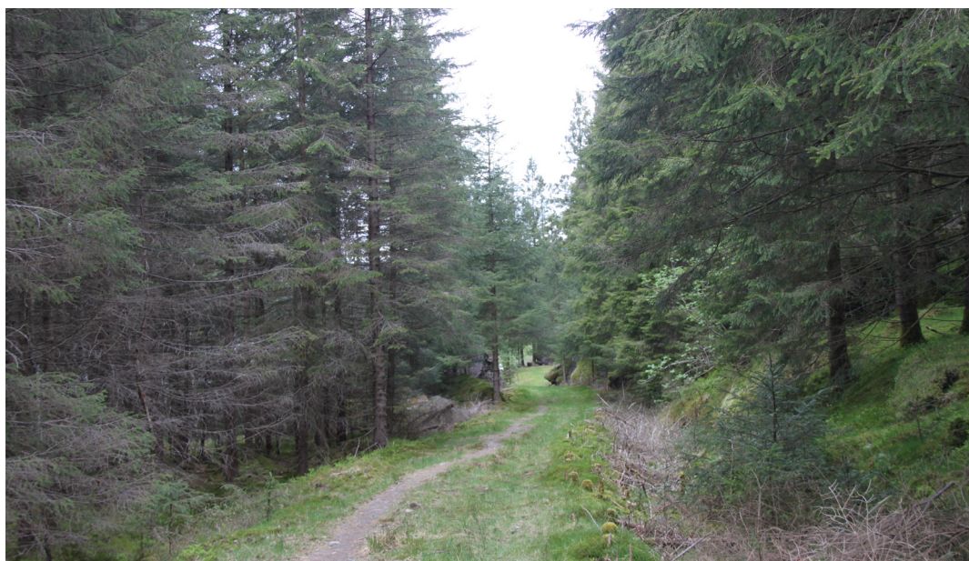
Frå Hansaskogen (Vassmyr) i Vindafjord

Skogselskapet har kontoradresse i Skogens hus i Pedersgata 32c i Stavanger, Holistic Center AS leigde fram til 1.10.25 alle areal som Skogselskapet ikkje brukte sjølv. Frå 1.11.25 er 2/3 av desse lokala leigde ut til Manneh Solutions.