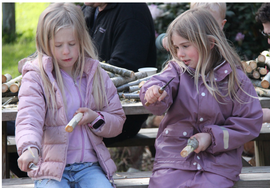
Frå Naturdagen på Dyrsnes ved Stokkavatnet i mai 2025.

Som ideell medlemsorganisasjon treng og jobbar vi for støtte frå våre medlemmer, og vi inviterer alle med interesse for skog og naturbruk til å melda seg inn i Skogselskapet. Som medlem får du tilsendt fire utgåver årleg av medlemsbladet Skog og Miljø, samt vår årsmelding med skogstatistikk og fagartiklar. Vi deler òg skogfagleg informasjon og inviterer jamleg til samlingar. Med støtte frå våre medlemmer ønskjer vi å vidareutvikla aktiviteten og nedslagsfeltet vårt i åra som kjem, og å veksa som samfunnsaktør og ressurs for heile regionen.