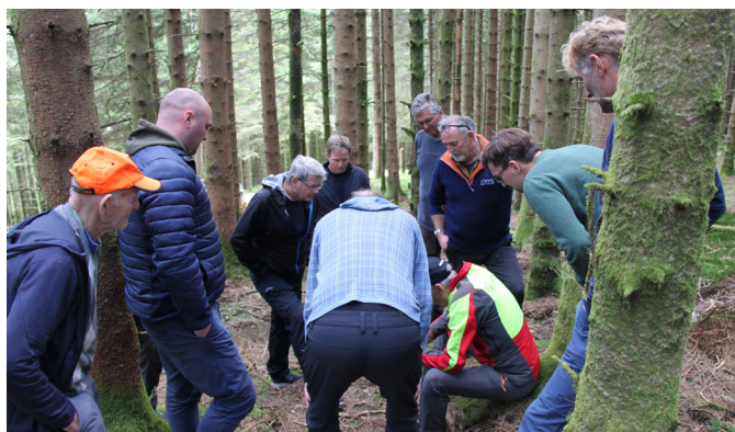
Frå fagdag i prosjekt «Aktive skogeiere» i Vikedal.