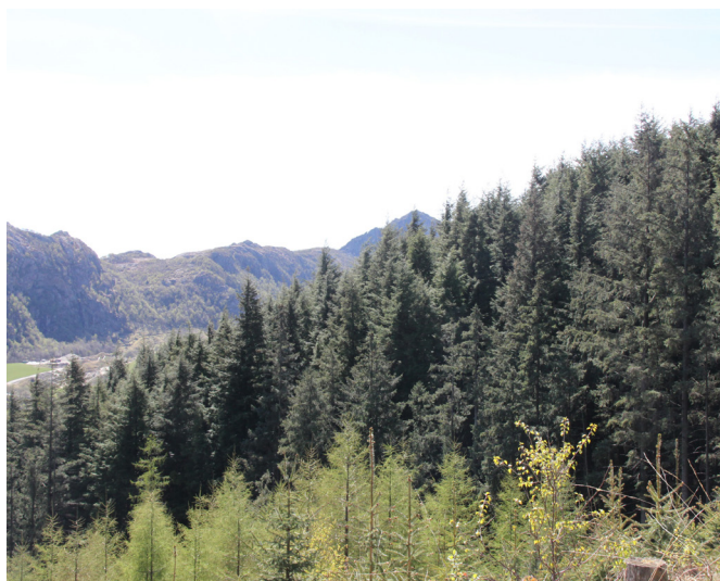
Frå Lien Skog i Bjerkreim.

Alle skogeigedommane til AS Skog er forsikra i forsikringsselskapet SKOGBRAND. I tilknytning til eigedommane er AS Skog deltakar i fleire vegforeningar og medeigar i fleire traktorvegar.