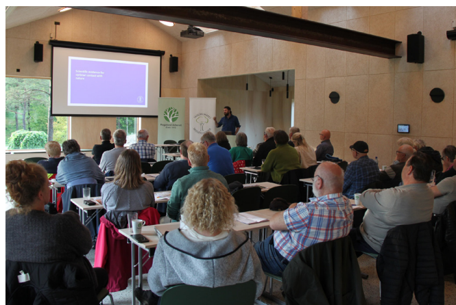
Frå årsmøtet i det nye bygget til Rogaland Arboret 5. juni 2025.